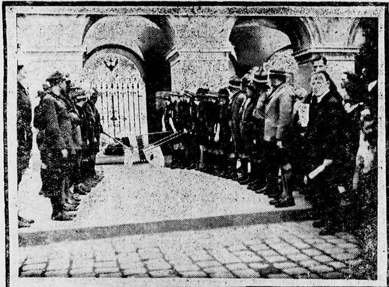
Tisztelgés a lengyel katonák síremlékénél.