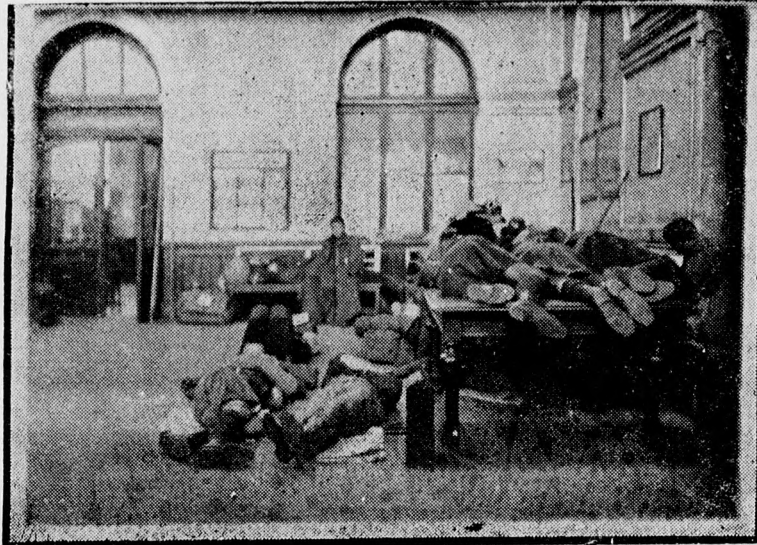
Utazás után édes a nyugalom...

A magyar fiúk rigai nagy győzelme nagy meglepetés volt, nem várták a külföldiek a magyarok ilyen nagy előretérését és még most is foglalkoznak a táborozáson történt eseményekkel. A finn lapok most is közölnek nagy tudósítá-