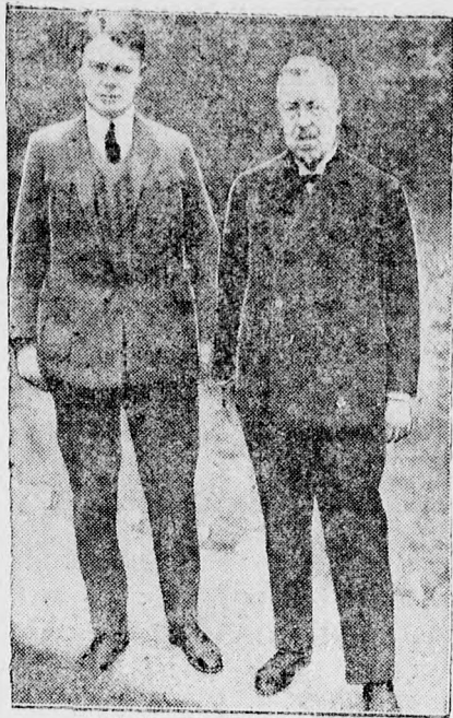
Eckener és fia,

akik a veszedelemben a Graf Zeppelint megmentették. Mialatt az atya megszórt művészetével kormányozta a súlyosan megsérült léghajót, fia, Eckener Kurt 600 láb magasságban a tenger felett a léghajó szárnylappján állott és dolgozott, hogy kijavítsa a hibákat.