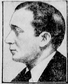
Egy szabályszerű atlanti-óceáni Zeppelin közlekedés finanszírozói. Balról jobbra: Warburg Felix bankár, Otto H. Kahn bankár, Henry Ford autógyáros, Clarence Dillon bankár.