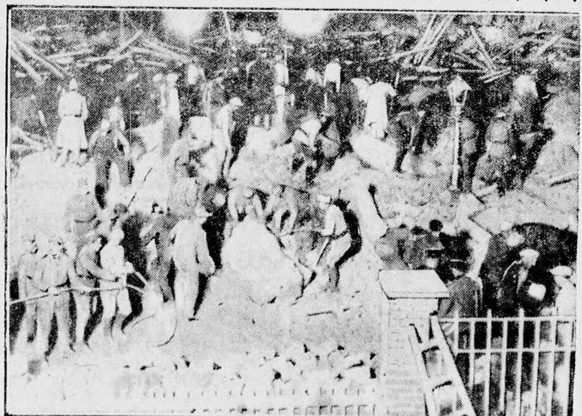
A páris—vincennesi házkatasztrófa. A beomlott ház romjai, amelyek alatt 23 ember lelte halálát.