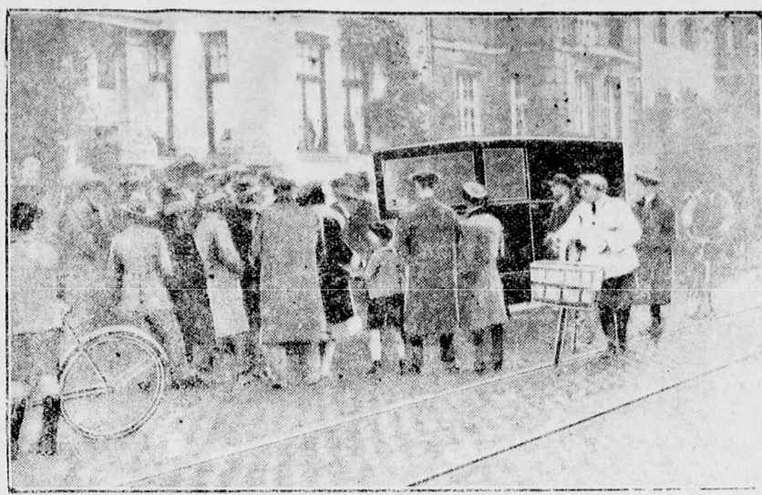
Az autó, amelyet a gyilkos Heidger-testvérek Kölnben használni akartak szökésükre.

A Debreceni Bélyeggyűjtők Egyesülete elkezdte őszi munkáját, összejövetelein érdekes sorsolásokat tart, jelentékeny eserét bonyolít le és közeljövőben fel olvasásokat is rendez. Nagyban folytak a decemberben rendezendő II. bélyegki állítás előkészületei is és örömmel je lenthetjük, hogy lapunk holnapi számá ban újra megindul a sok érdeklődést keltett bélyegrovat, most már természet esen illusztrációkkal színesítve.