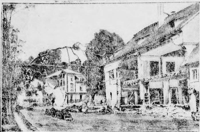
Városrész épült 15 hónap alatt. Az érchegységbeli Berggiesshübel községet az orkán majdnem teljesen elpusztította 1927 július 10-én. A katasztrófa után mutatja a kép a község egy uccáját.