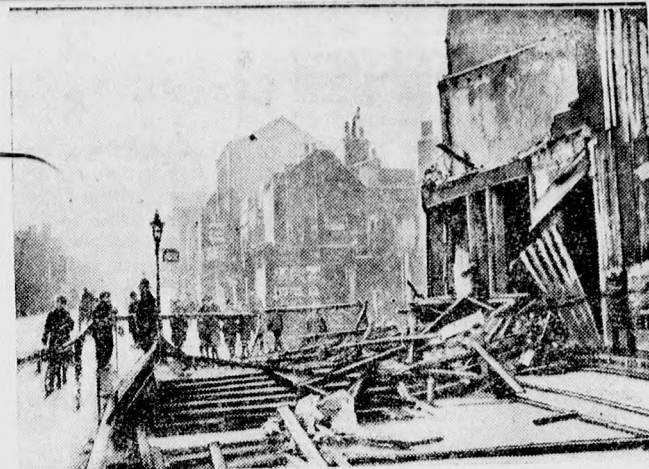
Az orkán pusztításai Angliában. Egy súlyosan megsérült ház a londoni Wall Street-en. Pusztítások a Waterloo Streeten.