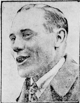
Nurmi, a csodafutó.

A világhírű finn futó, az antwerpeni, párisi és amszterdami olimpiász győztese, elfogadott egy amerikai ajánlatot és professzionista lett.