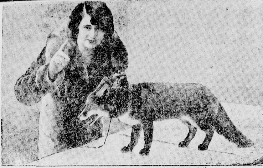
A nemes szőrméjű állatok berlini kiállításából. Fiatal vörösróka urnőjével.

5 pengőt megtakarít autótaxi költséget, mert gyalog átjöhét egy perc alatt a pályaudvarról. Nálunk utolján érj magad! Elsőrendű kiszolgálás szigorúan családi jelleg. Saját érdeke ezen előnyök folytán, hogy okvetlenül nálunk szálljon meg. Előzetes szobamegrendelés ajánlatos. Új telefonos szobák.