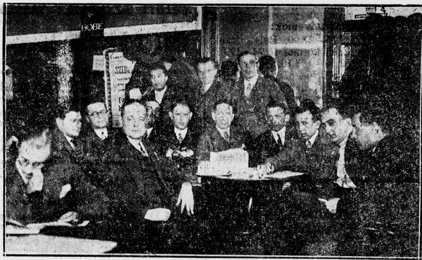
A Bocskay vezérkara tanácskozást folytat a Hungária-mérkőzés ügyében.