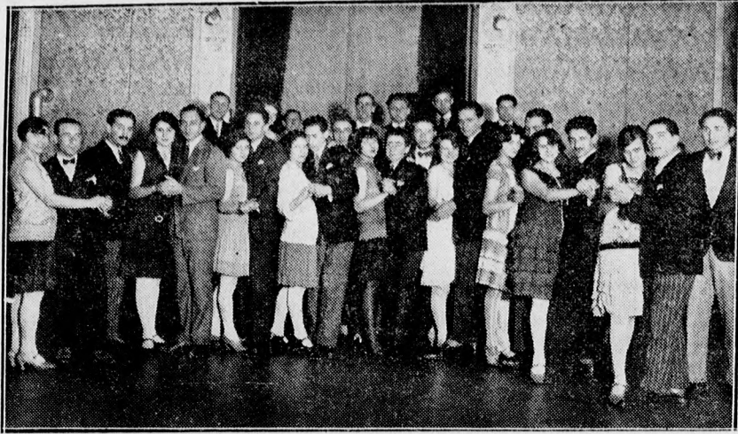
Megkezdődött a szezon a tánciskolákban is. Mai felvételünk a Bartalis-tánciskola növendékeit mutatja be.

Nagy érdeklődés mellett foglalkoztak a lelkészválasztási törvényjavaslattal dr. Révész Imre főjegyző előadásában. Az előterjesztett javaslat szerint a közgyűlés megállapítja, hogy a most érvényben