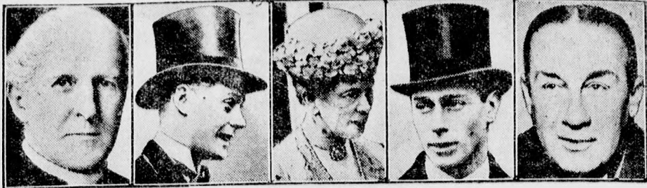
Az angol kormányzó bizottság.

Az angol király betegségének tartamára ez a bizottság látja el az uralkodói teendőket. Tagjai: a canterbury érsek, Edward walesi herceg, a királyné, Albert yorki herceg és Baldwin miniszterelnök.