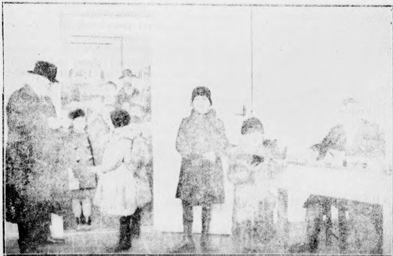
A debreceni népkonyha leghívebb látogatói a környékbeli iskolák növendékei. Mozgalmas élet van a déli órákban a népkonyha bejáratánál, ahol az egyik ellenőr a jegyeket lyukasztja át, míg a másik a jegyek felmutatása ellenében a kenyeret ossza ki. (Berzéki felvétele.)

kiadott hivatalos orvosi jelentés szerint a király a napot nyugodtan töltötte, a kimerülési folyamat nem emelkedett. Az érverés nyugodt.