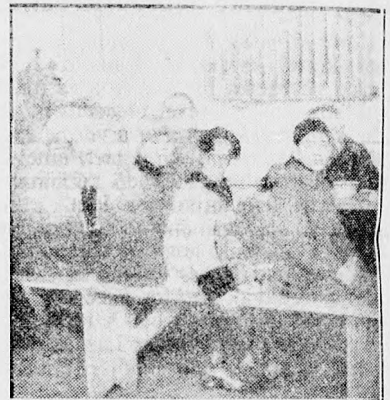
A nagy ebédlőterem egyik szögletében a fényképfelvételek felügyelnek az asztalnál ülők.

Főlemelő bibliai kép a népkonyha működése. Ott áll a terített asztal, a ritkán