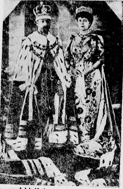
Az angol királyi pár koronázási díszben.