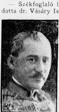
Dr. Vásáry István.

Debrecen új polgármestere, dr. Vásáry István székfoglaló beszédében, amely felölelte Debrecen város összes nagyobb problémáit, kitért a város vagyonának a kezelésére is, megemlítve, hogy gondolkozni kell a gazdálkodás új formájáról is. Ezt a kijelentést általános helyesléssel fogadta a törvényhatósági bizottság és érdeklődéssel várta mindenképpen, hogy a polgármester kijelentése milyen konkrétumokat von maga után. A székfoglaló beszédében egy tömör mondatban felvetett problémát dr. Vásáry István polgármester most szélesebben is megvilágítja egy szaklapnak adott nyilatkozatában. Az érdekes nyilatkozat, amely egészen új gondolatokat vet fel Debrecen város gazdálkodásával kapcsolatban, a következők: