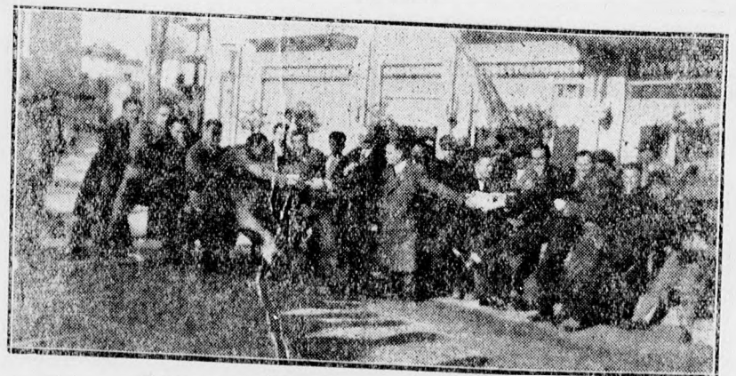
Trefás mulatozás a Bocskay athéni szállása előtt.

Görögországban a közönség elhalmozta minden jóval a debreceni fiukat, akik talán először életükben élvezték a tavaszt a télben. — A honvágy azonban mindennél erősebb és a Bocskay játékosai és vezetői is vágytak haza megszokott otthonukba. A legelső vonattal tehát elindultak hazafelé és Káldy főtájkár táviratban értesítette a vezetőséget, hogy a csapat szerdán este 10 óraker megérkezik Debrecenbe.