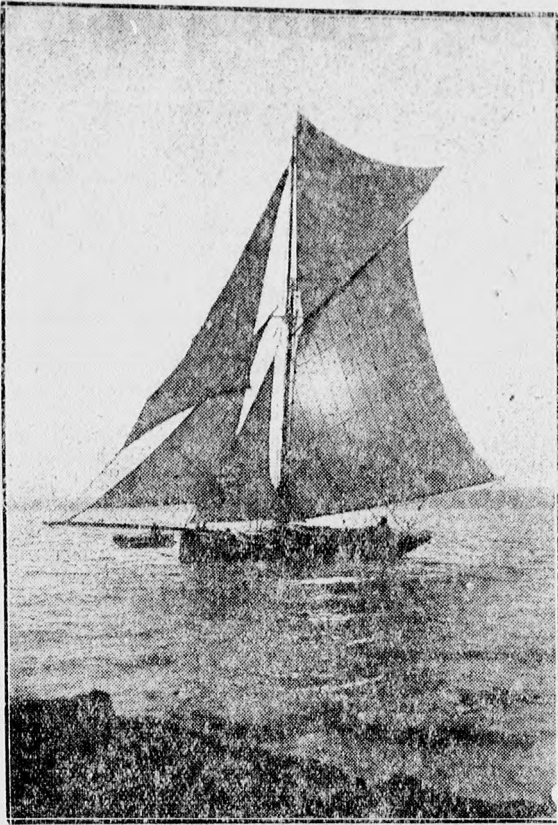
Vitorlással a Balatonon. (Amatőr-pályázatunk.)