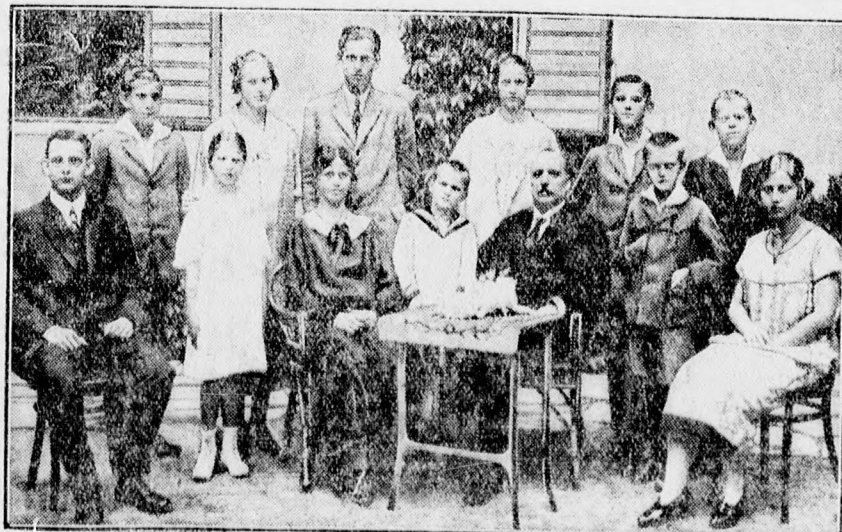
Dr. Miklas, az osztrák szövetségi elnök. Ausztria új elnöke hazájában egyik legtöbb gyermekes családapa. Tizenhárom gyermeke közül tizenegy él.

akik felváltva teljesítettek szolgálatot és tértek pihenőre. Százötven óra alatt több, mint 10.000 mértföldet tett meg a Question Mark, amelynek átlagos sebessége