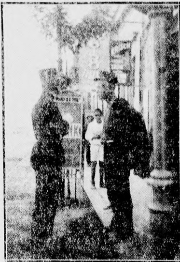
Ugy-e kár volt felönteni a garatra? ... Jakobovits Pál felvétele.

fogjuk közölni számos újabb pályamunkával együtt.