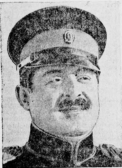
Zsivkovics tábornok, a szerb önkényuralom miniszterelnöke. Zsivkovics tábornok régi hive a Kara- gyorgyevics családnak, a most ural- kodó szerb dinasztiának; már résztvett Obrenovics Sándor király és Draga királyné meggyilkolásában is.

Belgrád, január 11. Az új kormány terveiről beavatott részről a következő értesüléseket sze- reztek a lapudósítók: