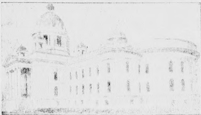
A szkupstina csaknem kész új épülete, amelyet Sándor szerb király most a katonaság rendelkezésére bocsátott.

Tégla és cserép legolcsóbban kapható Tóth és Sebestyén Rt. téglyagyárból. Eladás Hatvan u. 1-3. III. e. Telefon 610