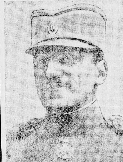
Sándor jugoszláv király, aki önkény- uralom megalapítására vállalkozott Európában.

A jugoszláv király negyven éves és 1921 óta uralkodik.