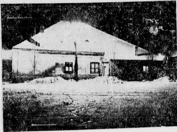
A tüzoltóaktanya téli éjjel. (Amatörpályázatunk.)