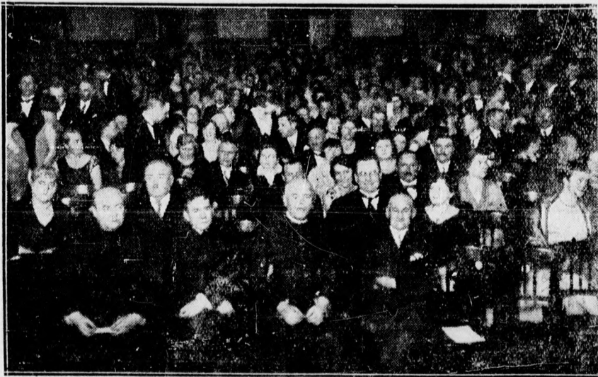
A MAV filmharmonikusok estélyének közönsége.