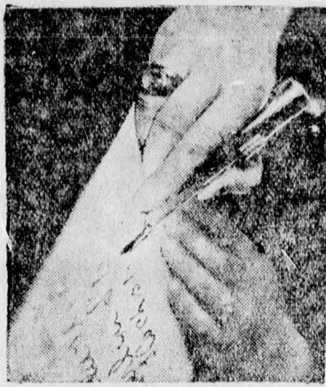
A sötétben is író ceruza.