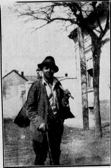
Drótostó. (Amatőrpályázatunk.)

a fiúnak Párisba kellett utaznia bélyegügyleteinek lebonyolítása céljából.