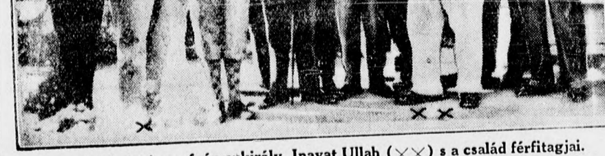
Aman Ullah (X) az afgán exkirály, Inayat Ullah (XX) s a család férfitagjai.

A legújabb afganisztáni jelentések a trónváltozás eseményeit úgy adják