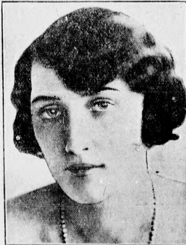
A norvég trónörökös eljegyzése. Olaf, a norvég trónörökös, a vőlegény. Márta svéd hercegnő, a menyasszony.