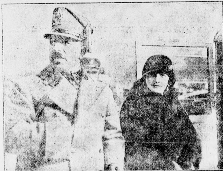
Az országból elmenekült afgán király, Aman Ullah s felesége, Suraja királyné berlini látogatásuk alkalmával.

ACZ E L'ANTIQUARIUMBAN SZÉGHENYI UCCA 2.