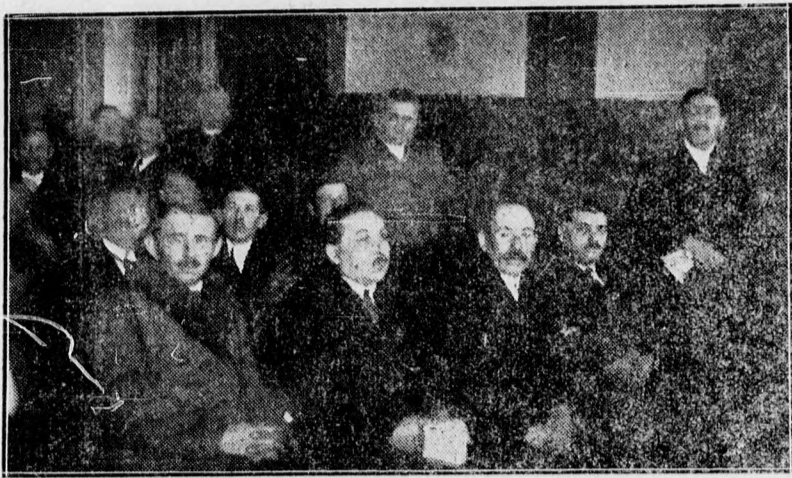
Pillanatfelvétel az ipartestület vasárnapi közgyűléséről.

— Mikor az egész család együtt van, használja fel az alkalmat, készítsen egy szép családiképet Liener műtermében Csapó uca 1. alatt.