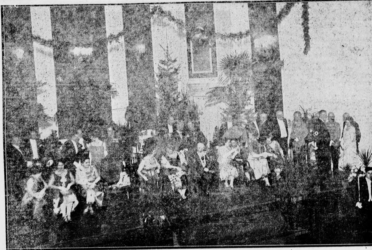
A védnöki pódium a jogászbálon.

A jog- és pénzügyi bizottság ülése. Debrecen város jog- és pénzügyi bizottsága szerdán délután ülést tart, melyen a januári rendes közgyűlés tárgyait készítik elő.