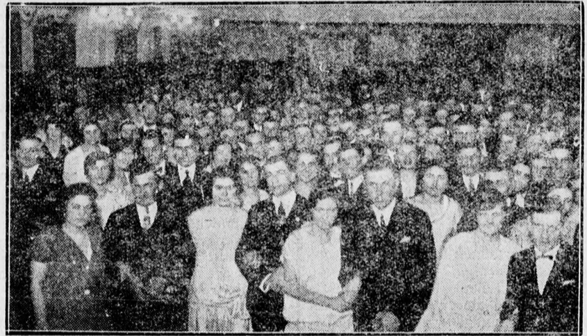
A vasárnapi gazdabál közönsége.