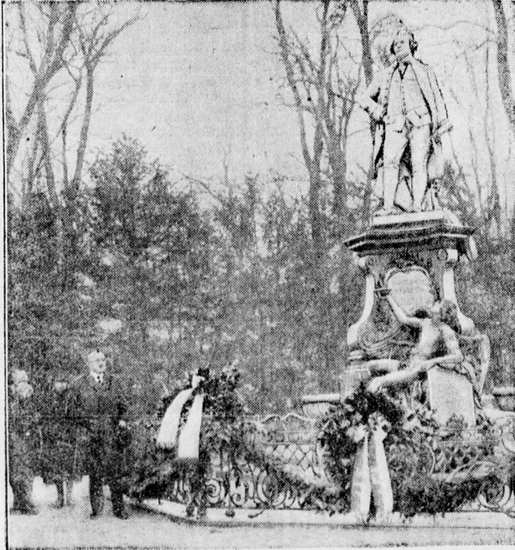
Lessing szobra Berlinben.