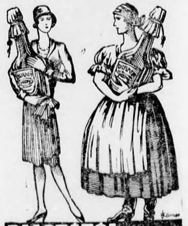
PALOTATOL KUNYHOIG DIANA SÓSBORSZESZ

Unghváry László Cegléd 500 tő évvelő virágot, Toepler Ottó Pusztamonostor, 140 tő különféle virágzó díszcserjét; Önálló gazdasági népiszkola Kisújszállás, 2150 adag különféle virágmagot; Székely taniskolája Tiszvágar 15 féle évvelő virá-