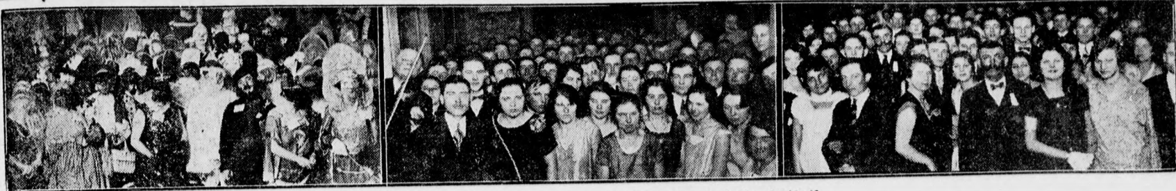
Felvételek szombat és vasárnap mozgalmas farsangi éjszakájáról. 1. A nyomdászok álarcos báljának egy álarcos csoportja. (Varga fényképész felvétele.) 2. A Függetlenségi Kör bál közönségének egy része. (Berzéki felvétele.) 3. A mozdonyfűtők báljának közönsége. (Berzéki felvétele.)