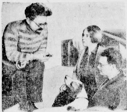
Az Oroszországból kiutasított Trockij családjával a szibériai fogságban.