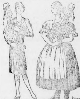
PALOTATOL KUNYHOIG DIANA SÓSBORSZESZ