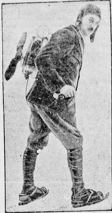
Uj találmány a jégsporthoz. Repülőgépmotor a korcsolyázó hátán. Ennek segítségével a korcsolyázó 80 kilométeres óránkénti sebességet ér el.

Amatőrök felvételeit kidolgozza, másolja, nagyításokat készít Berzéki fotobörze, Piac ucca 38.