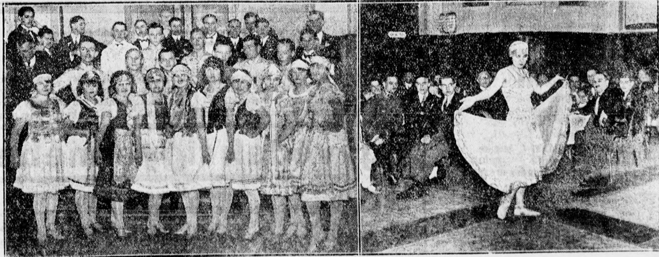
A református urasszonyok nagysikerű teadélutánjából.

Ezek mind lehetetlen rendelkezések, amelyek megfojtják a sajtószabadságot, megbénítják a sajtó munkáját. Csodálkozom, hogy Zsitvay Tibor a nyilvánosságra hozatal előtt át nem dolgozta