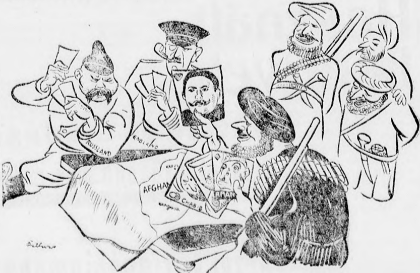
KARTYAJÁTEK AFGANISZTÁNBAN. Anglia és Oroszország játszanak Afganisztánban az uralomért. Az afgánnak azonban négy király van a kezében. Ki nyer már most?

9.15: Gramofonhangverseny. 9.30: Hírek. 9.45: A hangverseny folytatása. 12.00: Déli harangszó az egyetemi templomból és időjárásjelentés. 12.05: Zongorahangverseny: 1. Csajkovszky: Az évszakok. 2. Chopin: Prelüdök. 12.25: Hrek. 12.25: A hangverseny folytatása. 100: Időjelzés, időjárásjelentés, vizárlásjelentés. 1.30: Hírek. Élelmiszerek. Európa rádiója csütörtök délelőtt: Hangversenyek: Bécs (11.00). Königsberg (11.30). Kopenhága (12.00). Hannover. Prága, Mianó. Zürich (12.30). München (12.55). Róma (1.00). Köln (1.05). Toulouse (1.45).