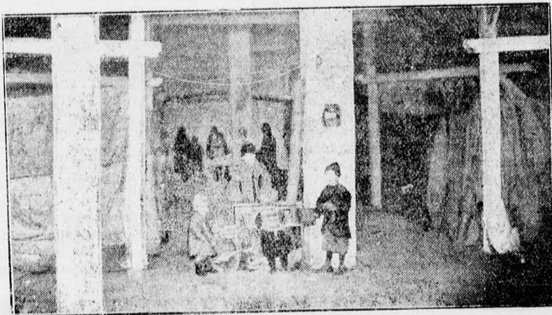
A Fekete-barakk deszka és papírfalai között a barakklakók gyermekei melegednek.

kegyetlen minuszok lépcsőjén, a vad szél trombitálva feszeged minden kis hasadékokat, a kályhák izzásig pattannak és a Fekete-barakk deszkafalai közé még akkor se lehetne meleget varázsolni, ha volna szegényeknek tüzelőfájuk. Ha volna... De nincsen!... Nincs tüzelőjük, nincs ruhájuk, nincs élelünk, nincs alvóhelyük,