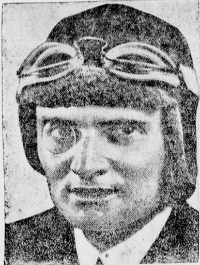
Hünefeld báró, az óceán egyik rettenthetetlen hőst most temették el imponáns részvét mellett Németországban. Hünefeld báró egy gyomoroperáció áldozata lett.

ezt a tervezetet. Ezt Zsitvay Tibortól nem vártam volna.