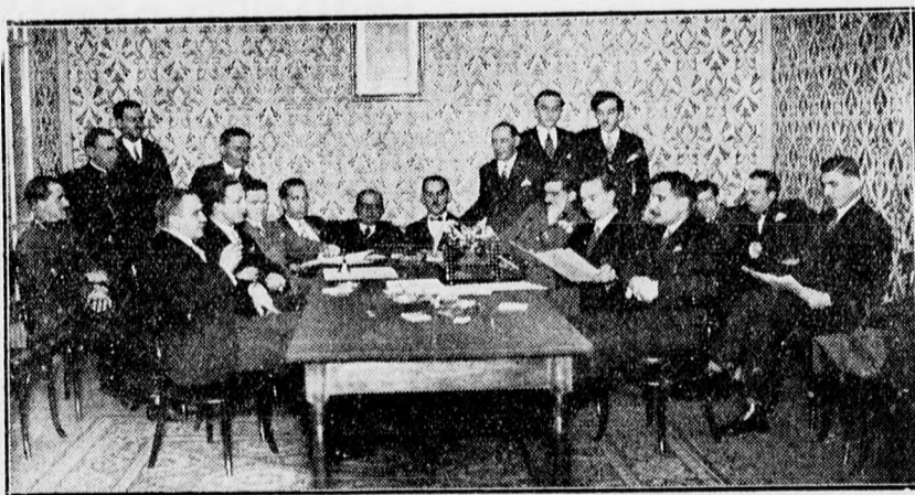
A Protestáns Bál rendezősége tanácskozik.

A ma este megtartandó Protestáns Bál iránt már hetek óta megnyilvánult óriási érdeklődés a tegnapi nap folyamán tető-