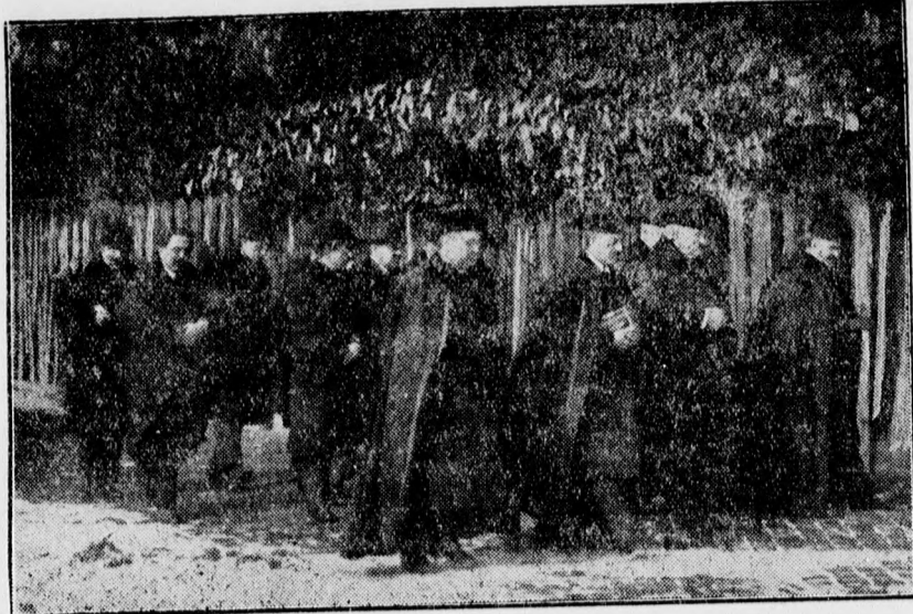
A lelkészek az Ispotaly templomba mennek az ünnepi istentiszteletre.

Borongós volt Jézus lelke is, amikor ezt a kijelentést tette. A nagy péntek előtti kedden Bethániába ment ki a forrongó Jeruzsálemből vacsorára és szállásra a Lázárék házához.