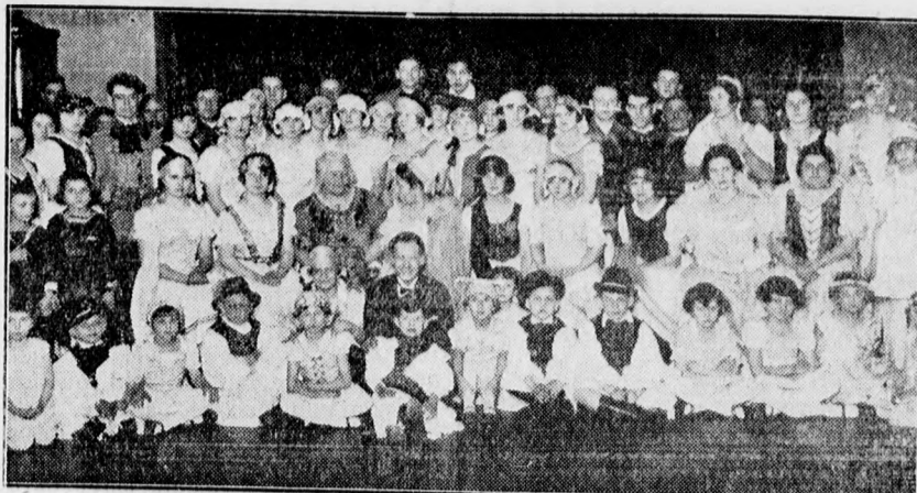
A hajduböszörményi MANSz szombat este nagyszerű jelmezes estélyt rendezett, amelyen igen sokan vettek részt Debrecenből is. Képünk a jelmezesek csoportját mutatja be.

Itt jegyezzük meg, hogy könyvecskék még késedelmi díj fizetése nélkül kiadhatók.