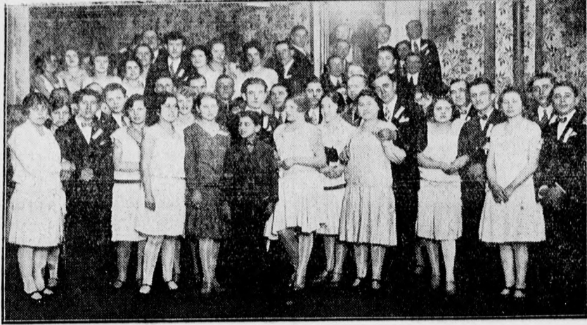
A hármastelepi olvasókör leánytagjai rendeztek szombat este az „Öreg tanya” vendéglőben nagyszerű bált. Képünk a közönség egy csoportjáról készült.