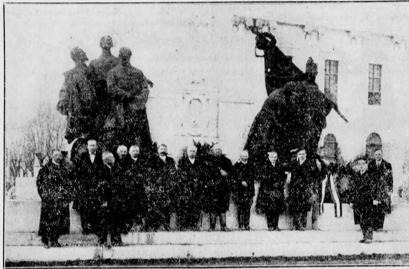
Kossuth Lajos halálának 35. évfordulója.

A Debreceni Független Újság és a Függetlenségi Kőr küldöttségei szerdán délután egy-egy nemzetiszínű szalagos babér koszorút helyeztek el a Kossuth-szoborra.