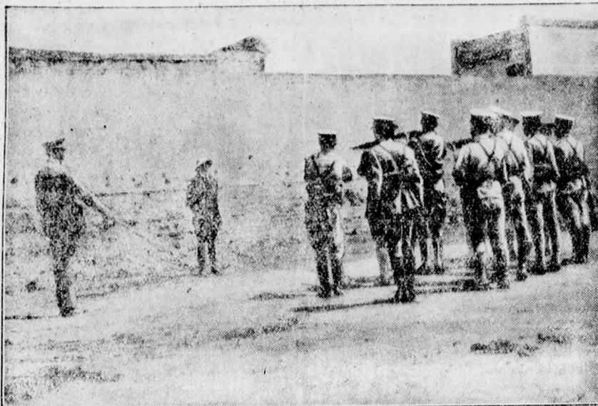
Egy forradalmár kivégzése Mexikóban.

Közöttünk, debreceniek között is élnek szép számban székelyek. Egyesek már évtizedek óta helybeli lakosok. Mások, a