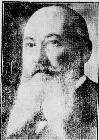
Tirpitz admirális, akinek neve a német haditengerészet fejlődésével szorosan egybeforrt, most ünnepelte 80-ik születésnapját.