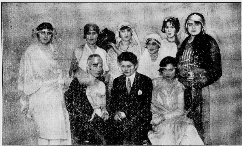
A Magyar Cionista Szövetség debreceni ifjusági csoportja által rendezett purimi ünnepélyen szereplők egy csoportja.

lay János Pogány Hiób című drámai jelenetét oly megrázó hatással interpretálta, hogy a közönség orkánzerű tapsa miatt még ráadás is kellett adnia, holott erre nem készült. Volt alkalmunk Grünhut Tibor kellemesen esendő baritonját is hallani, ki a már megszokott sikerrel néhány operáriát énekelt. Énekszámait