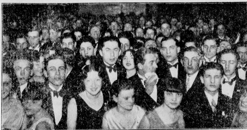
Zsidó reálgimnázium báljáról. A közönség a zsidó reálgimnázium bálján.

Bőrönd és bőrdíszműáru csak képesített bőrdíszmesternél vásárolhat bizalommal FEUERMANN bőrdíszmester (PIAC U. 26.) Rambouillet-passage.