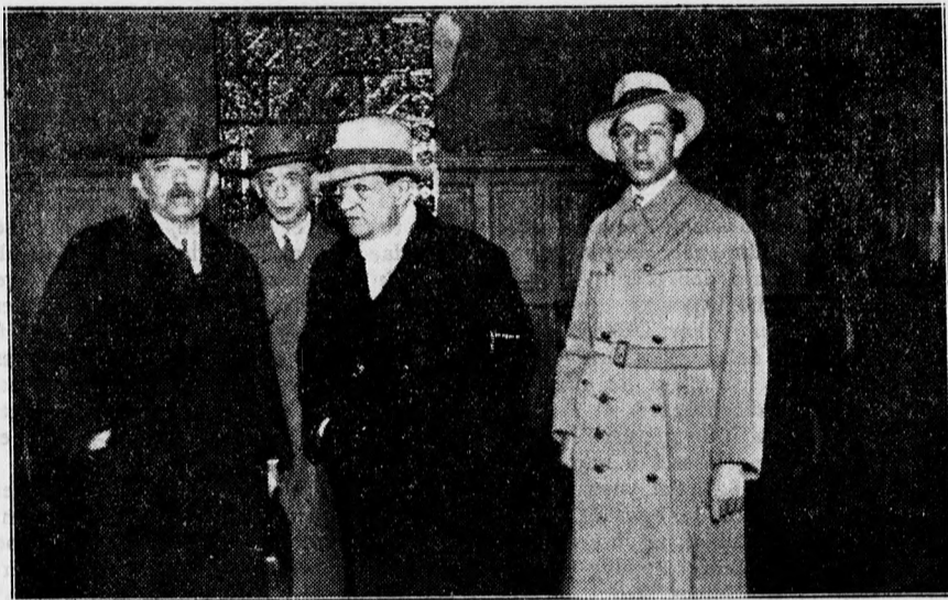
Karinthy Frigyes megérkezett Debrecenbe.

Az autogramokat bizonyára eladás megkezdésével kíséri az író, aki mint