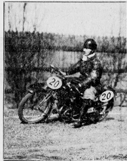
A 20-as szőlógép a kanyarban.