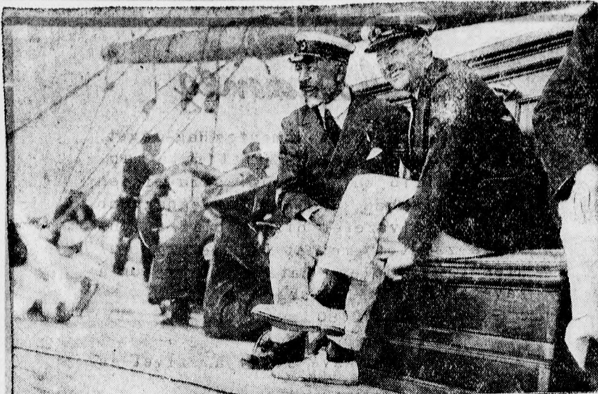
Henrik porosz herceg elhunyt. A herceg (a szakállas alak) a német tengerészetnek volt nagydírmirálisa. Nagy kedvelője volt a vitorla, motorcsónak és autómobil sportnak, amelyeket nagy szenvedéllyel űzött is.

10000 üzletüket felkérve vették ki a listáról.