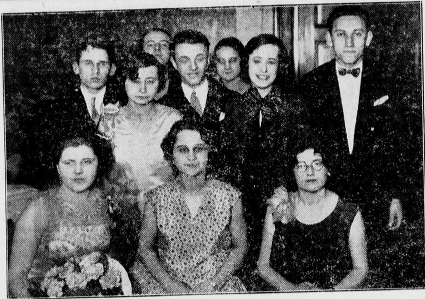
A zenede nagyszerű növendékhangversenyének a szereplői.

Bécs. 11: Hg. 4: Hg. 5.40: Kz. 7.30: Hg. Berlin. 5: Dalok. Hg. 8.30: Népszimnő. Belgrád. 8: Vigjáték. 8.45: Hg. 10.05: Jz. Bern. 6.15: G. 8.55: Z. 9.20: Hg. Brunn. 7.05: Hg. 7.30: Rádiójáték. 10.20: Hg. Frankfurt. 8: Hg. 9.50: Közv. 12.30: Hg. Genf. 8.50: Hg. Genova. 8.40: Hg. Hamburg. 8: Z. 9: Tz. 11: Tz. Kopenhága. 8: Hg. 8.30: Bohózat. 10: Kz. Königsberg. 4.30: Z. 7.30: Hg. 10.30: Tz. Kattowitz. 5.25: Közv. 5.55: Hg. 8.15: Hg. Lipsce. 4.30: Z. 8: Hg. 10: Tz. London. 7.45: Cechmann-dalok. 8.45: Kz. 10.20: Szimnő. Milánó. 5: Jz. 8: Hg. 11: Jz. München. 4.30: G. 8: Hg. 9.20: Hg. Nápoly. 5: Hg. 9.02: Operett. Oslo. 8: Szimf. Hg. Pozsony. 4.30: Kz. 6.05: G. 7: G. 10.20: Tz. Prága. 4.25: Kz. 7.05: G. Tz. 10.20: Nz. Tz. Posen. 5.55: Hg. 8.15: Hg. 10.20: Tz. Stockholm. 5: G. 6.30: Nz. 8.15: 9.45: E. Stuttgart. 4.15: Hg. 6: Z. 8: Kz. 9: Vigjáték. 9.50: Hg. Toulouse. 9.30: Kz. 10: Hg. Turin. 5: Nz. 8.55: Hg. Varsó. 5.25: Közv. 8.15: Hg. Zágráb. 8.15: Zenei ABC. 8.35: Hg. 10: Nz. Zürich. 5.15: G. 8: Tarka-est.