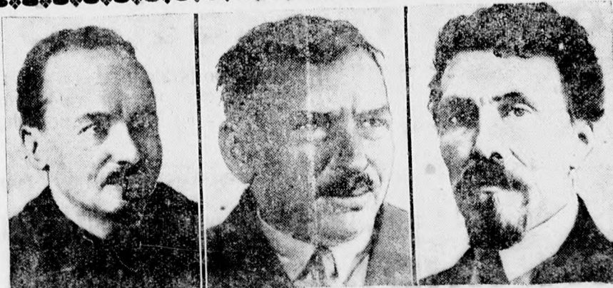
Szovjetoroszország három vezető politikusa, Bucharin, Tomsy és Rykow, a többi vezetővel szemben támadt nézeteltérés miatt kiléptek a kommunista előljárárságból.