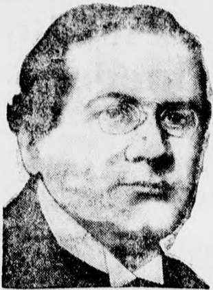
Litvinov Maxim orosz népbiztos, aki a genfi leszerelési bizottság ülésén az általános leszerelést indítványozta.

már rossz idő esetén is 2000 nézőt találunk a Boesky mérkőzéseim, nem szabad lemondanunk a lehetőségről, hogy a kupamérkőzések is megtalálják majd közönségüket Debrecenben, hogy a közönség nem csak bainoki küzdelmet, hanem csupán élvezetes futballt ígérő mérkőzéseket is látogat.