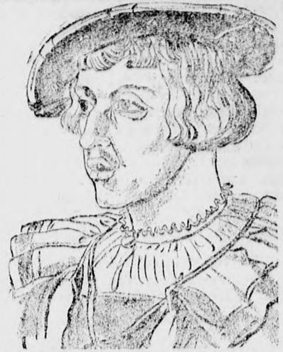
I. Ferdinánd, bályjának, V. Károlynak a képviselőtében ő nyitotta meg 400 év előtt a speyeri országgyűlést, amelyen az evangélikus fejedelmek 1529 április 25-én felekezetiük jogait követelték.

Liener műterme az ünnepek alatt reggel 8-tól délután 6-ig nyitva van.