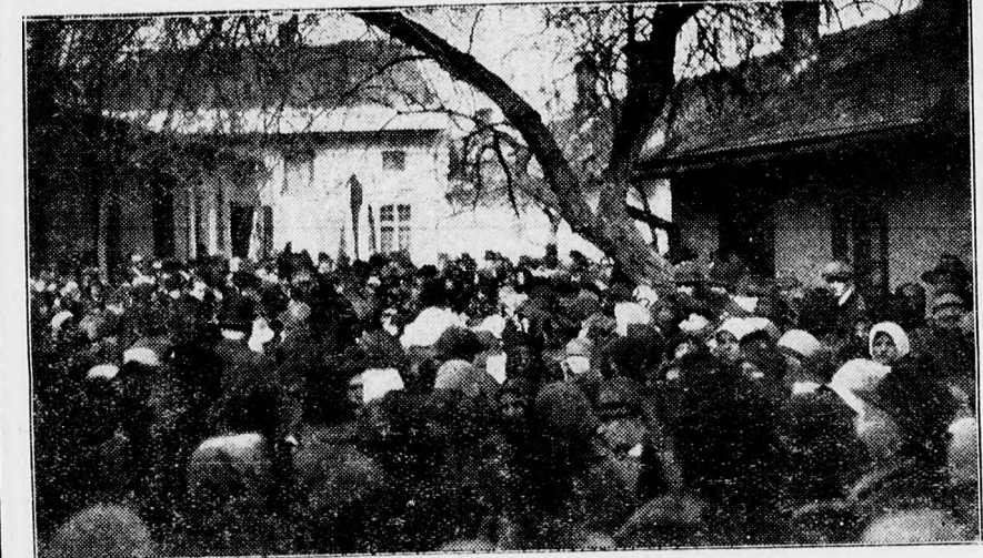
A hatalmas gyászoló közönség egy része a gyásház udvarán.

zési vállalat tulajdonosát. Bár a temetés ideje 3 órára volt kitűzve, már két