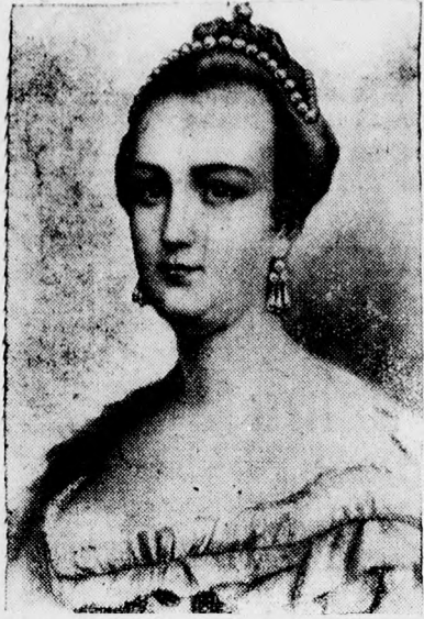
II. Katalin, Oroszország nagy cárnője.

A nagy cárnőnek most van 200-ik születésnapja. II. Katalin, mint anhalti Zerst hercegnő született 1729 május 2-án és 1745-ben ment férjhez III. Péter cárhoz, akit 1762-ben történt meggyilkolása után követett a trónon. Kiváló szellemi képességekkel vezette a nagy birodalom ügyeit. Uralkodása alatt divott a kegyencs uralom és a kegyencek között egyik leghatalmasabb miniszter lett Potemkin.