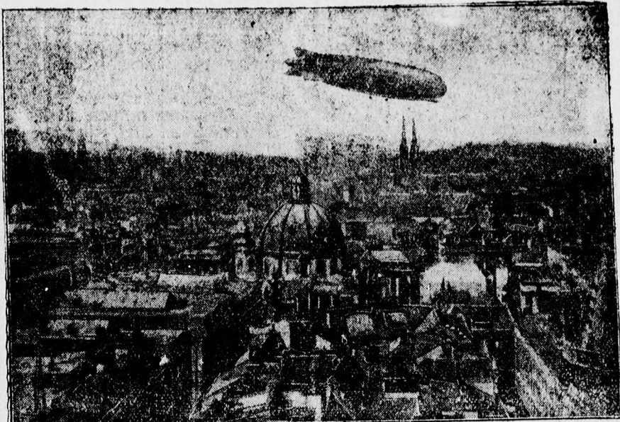
A Graf Zeppelin legutóbbi útja alkalmából, amikor Friedrichshafenből 4 óra 19 perc alatt repült Bácsba, Bács város felett.