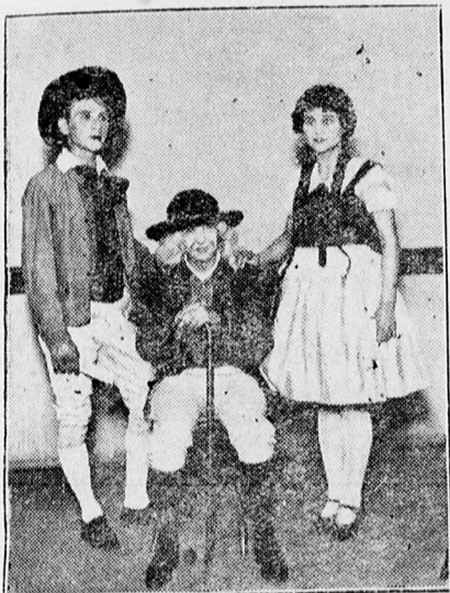
...és a Varázshegedűt.