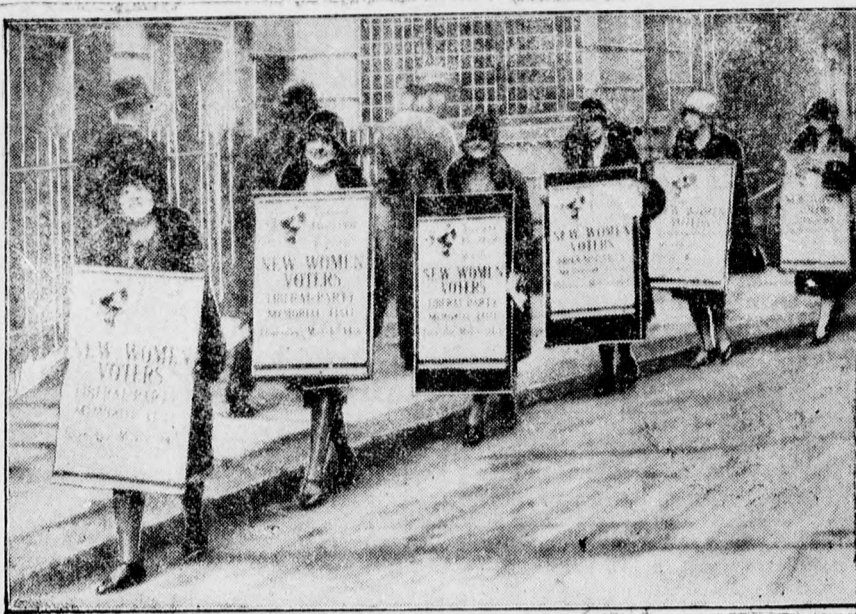
Harc az angol női szavazatokért. A liberális párt plakáthordozói.