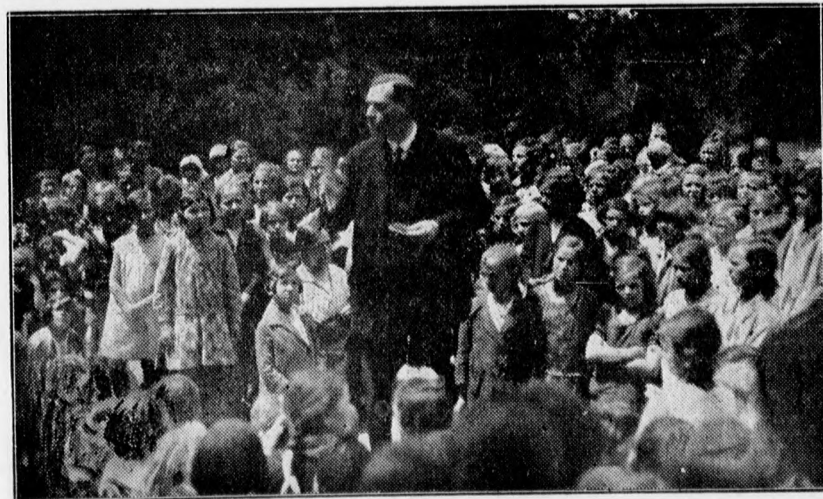
A vasárnapi iskolák mintegy 1500 tanulója tanítóinak vezetésével a Nagyerdőre egésznapos kirándulást tett.

Négy év előtt lett beteg. Súlyos baleset érte. Elcsuszott hivatalában, elvágódott és ekkor súlyos sérüléseket szenvedett s egyik lába is eltört. Hónapokig feküdt meg az ágyat, azonban minden gondos ápolás ellenére lassan hakerője volt.