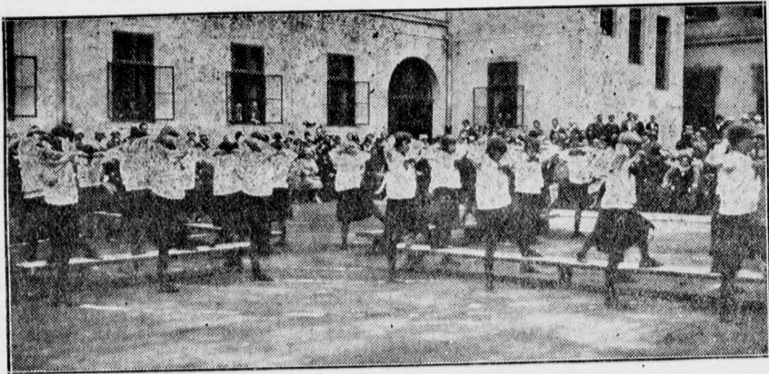
A Szeváts-intézet tornavizsgálója. A növendékek egyik csapata zenére végez szabadgyakorlatokat.