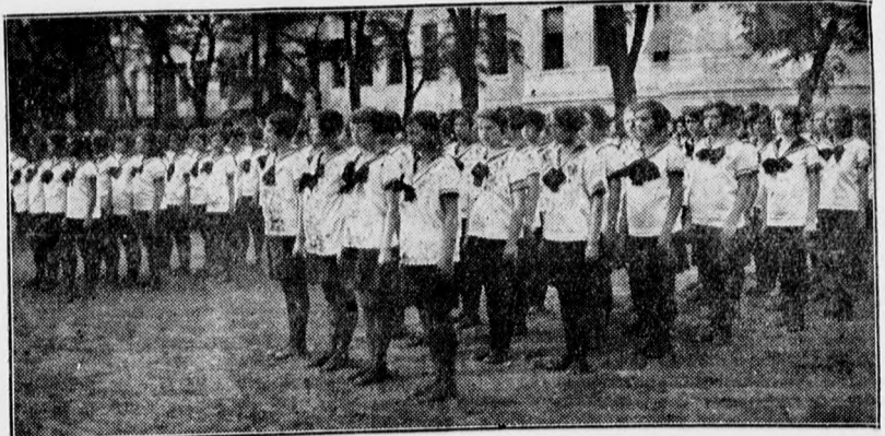
A Dóczy-intézetben vasárnap folyt le nagy sikerrel a ref. tanítónőképző tornavizsgáló.