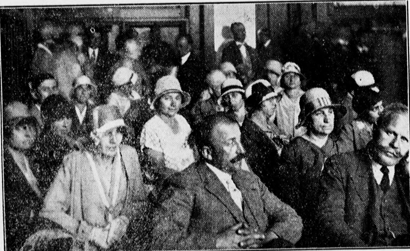
A hajdumegyei tanítók Gönczy Egyesülete a megyeháza nagytermében tartotta a közgyűlést.