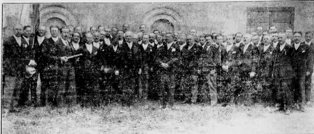
A kormányzói díjat nyert egri dalárda.