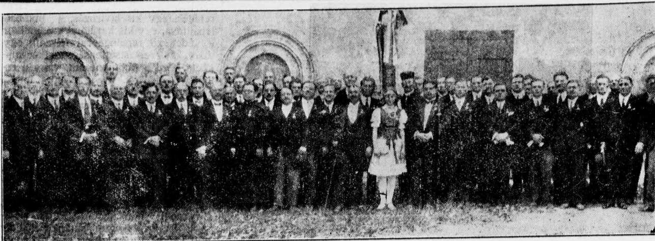
A szegedi dakárda férfitagjai a debreceni országos dalosversenyen.