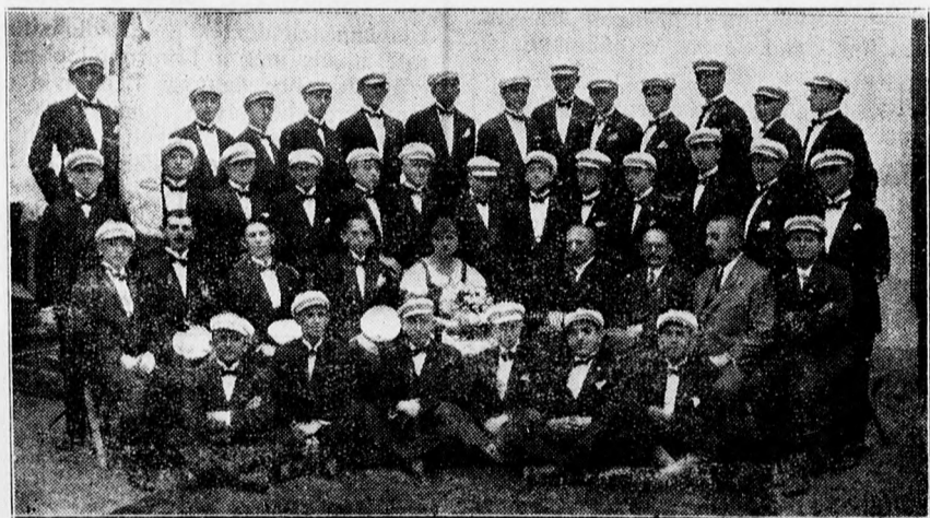
A debreceni izraelita ifjak dalköre az országos dalosversenyen.

és Szekeres hat évi fegyház büntetését négy évi szigorú dologházra, Nagy Sándor büntetését pedig három évi fegyházban állapította meg. Az ítélet jogerős.