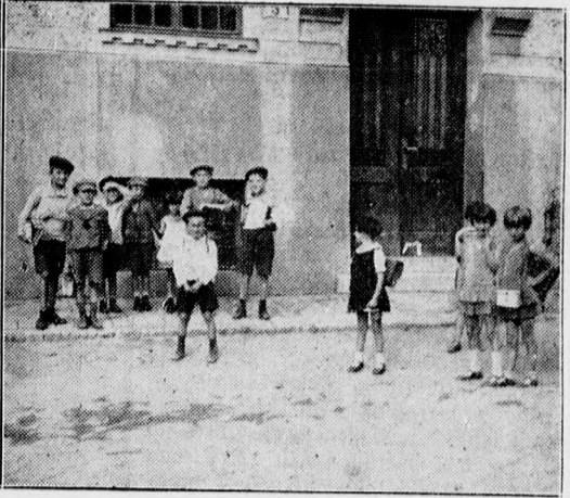
Szeptember van, megnyiták az iskolák...