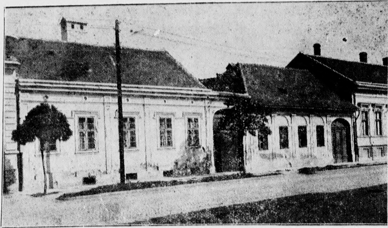
A Bethlen ucca 9. és 11. számú ház, amelyek helyén a Déri térre új uccát nyitnak.

Tankönyvek az összes iskolák részére a legújabb kiadásokban. Iskolaszerek a legnagyobb választékban és olcsó árban beszerezhetők Hegedűs és Sándor RT könyv-, papír- és iskolai szerek kereskedésében. Ferenc József ut 34.