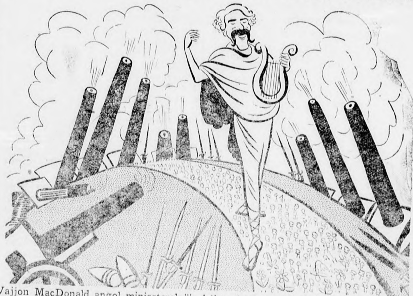
Vajjon MacDonald angol miniszterelnök békeszövege az ágyuk és fegyverek hangját túl fogja-e harsogni?