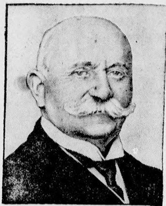
Gróf Zeppelin Ferdinánd, a német léghajózás nagynevéü megalapítója.

megkezdje és ez az alkalom kiválóan meg is felel erre, hiszen a magántisztviselők és magánalkalmazottak ezreit érdekli a készülő törvény és így azok részvételére is számít, akik nem tagjai az egyesületnek. Az előadást ugyanis vita követi, amelynek során mindenki elmondhatja nézetét, tapasztalatait, óhajait, közvetve tehát ezáltal minden magántisztviselőnek alkalma nyílik arra, hogy belefolyjon a készülő törvény módosításába, amikor szöveges panaszait, óhajait, mindazokat a visszajelzéseket, amelyek eddig törvény hiányában gyakran előfordulhattak.