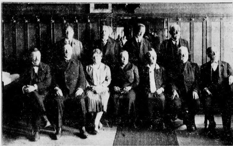
Teologusok 40 éves találkozója.