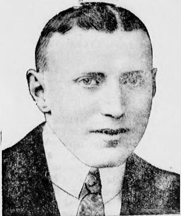
Nickels rendőrkapitány, akinek letartóztatása nyomán a rendőrség nyomára jutott a német parlament ellen elkövetett bombamerénylet tettesének.