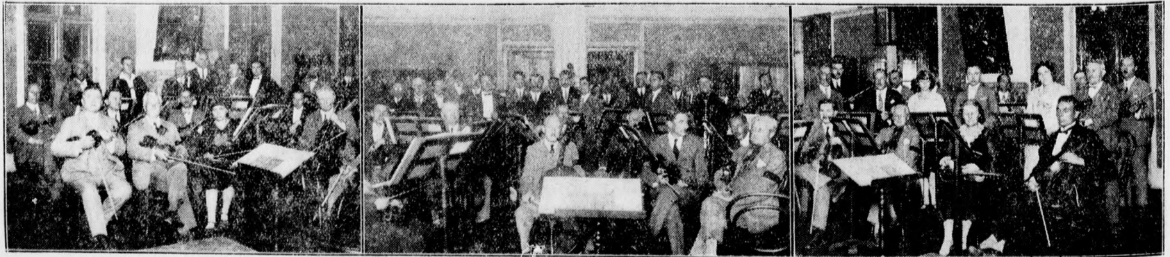
FELVÉTELEK A MÁV. FILHARMONIKUS OK PRÓBAJÁRÓL.

Beethoven műveiből; másnap ugyanazt a zenekart egy másik, tekintélyes polgár vezényli, sőt sokszor a polgármester maga. A zene tisztelése olyan hagyomány, hogy kiérdemesült polgárok jutalmul kapják életük alkonyán a tiszteletbeli karnagyi címet, úgy, amiként nálunk tb. főügyészek meg tb. tanácsnokok lesznek az érdemes multu városi férfiakból. És még a vasárnap délutáni tarokk-partinál is nagyobb öröm ezeknek a német hivatalnok, kereskedő vagy iparos uraknak, kiállani a zenekar élére és ha csak mímelve is a „vezénylést”, de mutatni legalább a zene évszázados, atavisztikus tisztelétét. Persze, tisztában vagyunk mindannyian azzal, hogy az ilyen tiszteletbeli karnagyok nem viszik előre a muzsika ügyét, lustán ló-