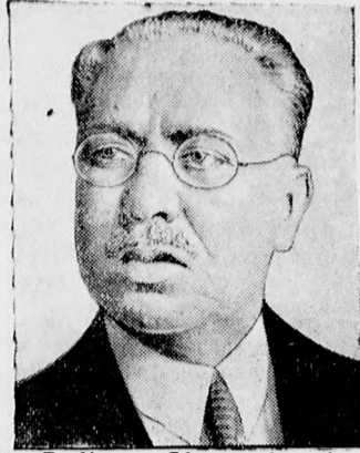
Ortíz Rudío, az Obregon-kormány volt kereskedelemügyi minisztere, Mexikó elnökjelöltje.

Schober kancellár beszéde után Danneberg képviselő kifejtette a szocialdemokrata párt álláspontját. Felszólalása általában mérsékelt hangú volt. Részletelesen foglalkozott az alkotmányreform kérdésével, amelyről ezeket mondta: — Igaz, az alkotmány sem neántsvirág. Jó lenne azonban, ha a kormány nem állana máról holnapra más-más javaslat elöl, hanem egyszer terjesztenél be a reformjavaslatokat. Az alkotmánynak mindenesetre meg kell felelnél a tényleges hatalmi viszonyoknak. Azt azonban semmiféle alkotmányreformmal nem lehet előírni a szocialdemokratáknak, hogyan szavazzanak. Az az alkotmány, amelyet csak gázbombákkal és gépfegyverekkel lehet keresztülérszokolni, csak illuzió. A munkásosztály ma sokkal nagyobb és erősebb annál, hogy belenyugodjék abba, hogy kezdettől fogva kisebbségre ítéltessék egy ipari állam parlamentjében.