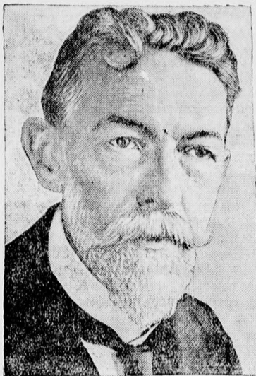
Dr. Zsigmond R., a magyar származású tudós, a göttingeni egyetemen a szervetlen kémia tanára, aki 1926-ban megnyerte a Nobel-díjat, meghalt.