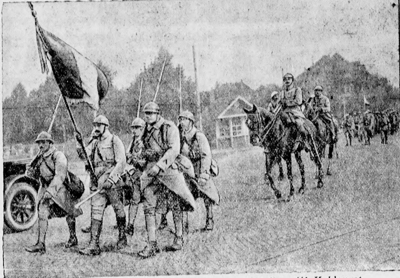
A Rajnavidék kiürítése. A francia katonák elhagyják Koblenzt.