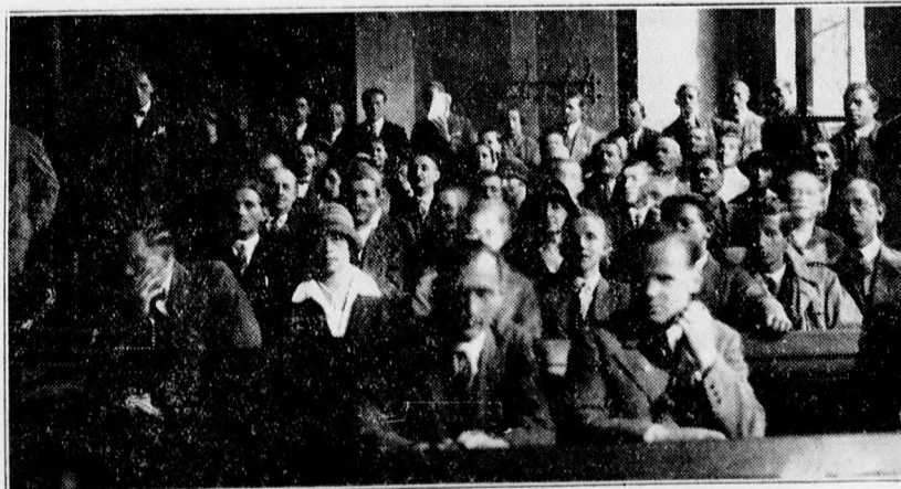
A hallgatóság feszült figyellel kíséri a tárgyalást.

Az elnök: Megnyugszik az ítéletben? Az elítélt: