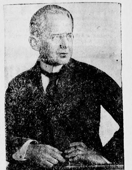
Arno Holz, a világhírű porosz költő 66 éves korában Berlinben meghalt.