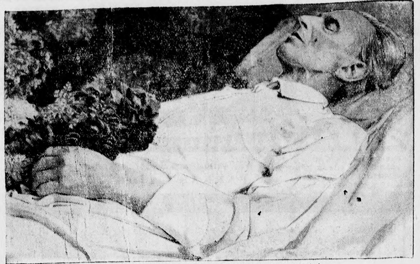
A 66 éves korában most meghalt világhírű német író: Arno Holz a ravatalon.

Külföldön az 1924. évben Milánóban, a múlt napokban október hó elején Londonban volt a második nemzetközi takarékoskossági kongresszus, melynek tárgyalásait a munkáspárti kincstári kancellár pénzügyminiszter Snowden beszéde nyitotta meg. Magyarország porbasújtott állam s ha nem akar megsemmisülni, fel kell emelkedni a porból. Azonban felemelkedése csak úgy marad állandó, ha idegen kéz támogatása helyett saját magában gyűjti és fejleszti erőit. Nemzetünk megerősödésének pedig egyik legeredményesebb tényezője a takarékoskodás erénye. Apró tőkékből épülnek fel a vagyonok s így ebből a szempontból minden fillér számít, minden fillér egy csepp a nemzet gazdasági vérkeringésében. Takarékoskodásunk csak úgy eredményes, csak akkor szolgálja a köz javát is, ha megtakarított filléreinket a gazdasági élet vérkeringésébe adjuk, ahol a gazdasági vénán át a gyűjtömedencébe jut és a nemzeti nyereség szolgálatába áll. Magyarország tökeszegény ország, mely ma még külföldi tőkéket kénytelen felhasználni, hogy új erőt vigyen gazdasági életébe. Mennyivel hasznosabb és célszerűbb volna azonban, ha a belföldi kis tőkékből összekovácsolt nagy tőkéket állanának közgazdaságunk szolgálatára s így a kamat nem vándorolna külföldre idegen államok vagyonának növelése céljából, hanem belföldön maradna, a belföldi kis- és nagytőkések vagyonát s ezáltal a magyar nemzeti vagyont gyarapítani. A takarékoskosságot csak megkezdeni nehéz, ha azonban a kezdet nehézségein átvérgődünk, a