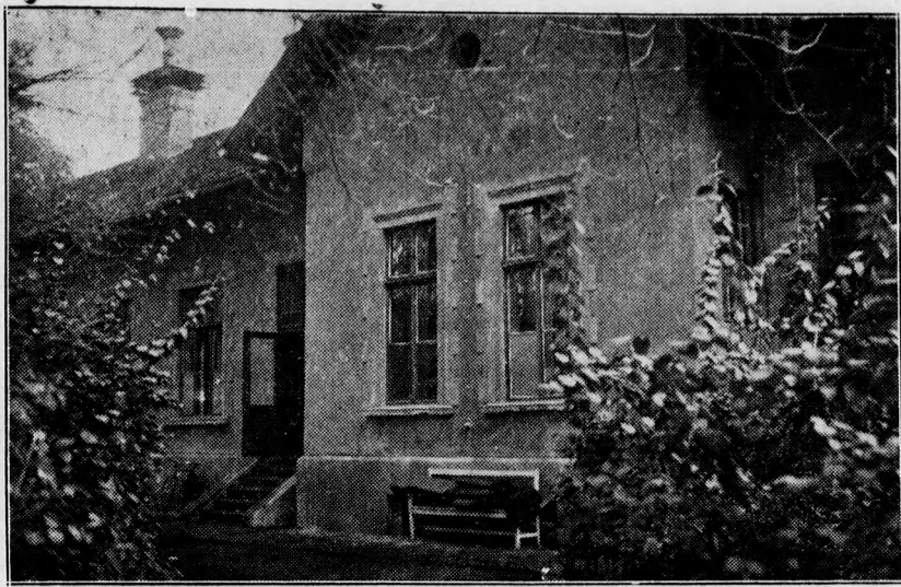
A régi közkórház járványosztálya, ahol most a járványkórházat megnyitották.

— „Szölik az asszony” operett gramofonlemezei és kottái kaphatók a Hegedűs és Sándor rt. könyv- és zeneműkereskedésében.