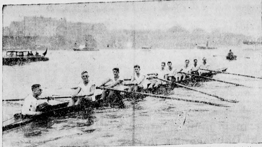
A berlini egyetem evezős nyolcása, amely az idén a minden esztendőben megtartott főiskolai verseny győztese lett.