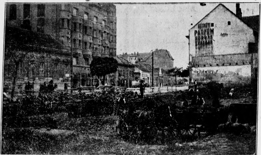
Megkezdtek a postapalota építkezését.