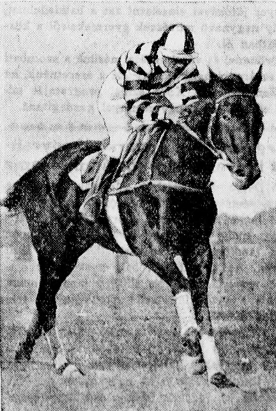
Trumpfeller jockey, akire egy berlini lövésznyen olyan szerencsétlenül zuhant rá a lóva, hogy szörnyethalt.

— A múlt tapasztalatai azt mutatják, hogy Oroszország a lehető legnagyobb előnyt akarja magának biztosítani a nemzetközi szerződésekből, anélkül azonban, hogy maga megtartsa a szerződéseket.