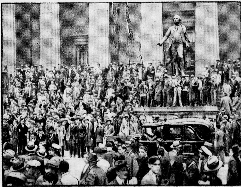
Ilyen tömeg táborozik állandóan a newyorki tőzsde előtt a krach első perceitől kezdve.