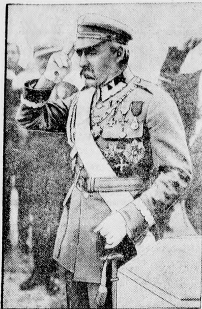
Pilsudsky marsall, aki súlyos konfliktusba keveredett a szemmel.

— A jelzőjogról szóló 1927: XXXV. örvénycikk és az összes rendeletek ügyes összeállításban, könnyen kezelhető zsebkönyvben, kemény kötésben megjelent. Ára: 4 pengő. Kapható Hegedüs és Sándor R. T. könyvkereskedésében. Telefon 54. Ferenc József ut 34.