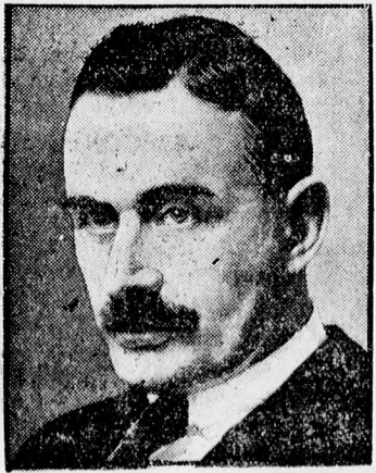
Thomas Mann, a világhírv német írv, a Budenbrook és a Varázshegy szerzője, akinek most odaitették az irodalmi Nobel-díjat.