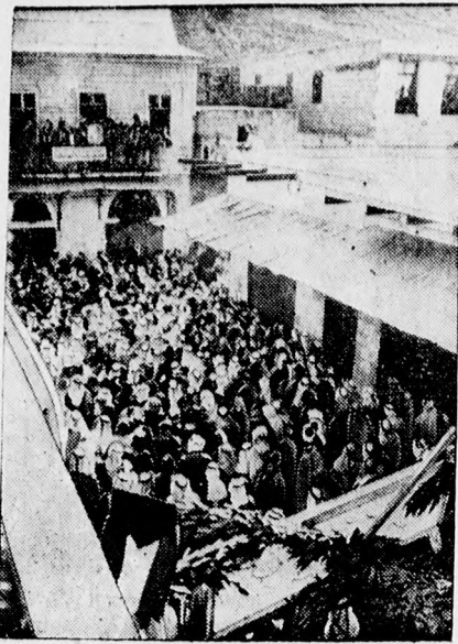
Az ammani (Szíria) arabok tüntetnek a palesztinai események miatt.