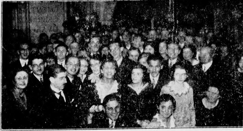
A magántisztviselők új otthonának felavatásán résztvettek egy csoportja.