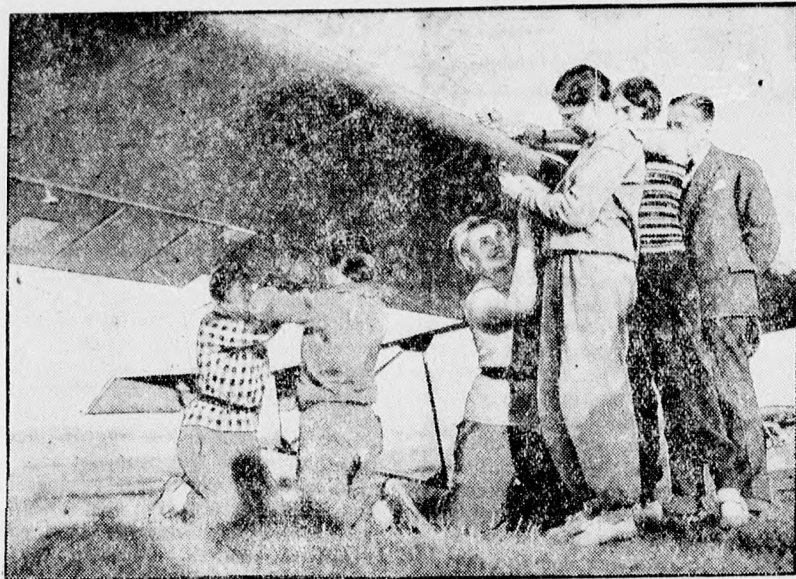
Terjed az aviatika a nők körében.

legolcsóbban kapható KESZLER A.-nál SZÉCHENYI U 1. SZÁM ALATT.