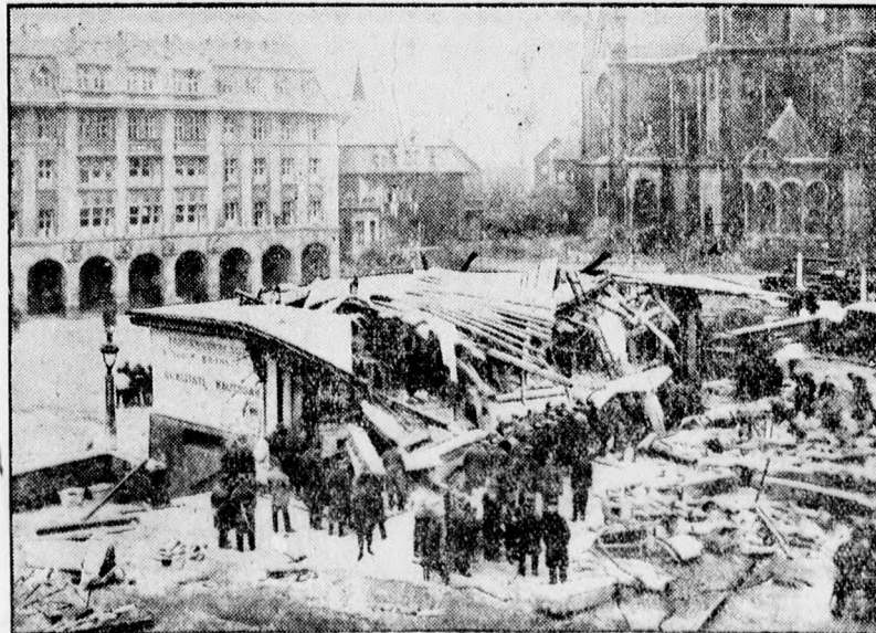
Az esseni vásárcsarnok képe a nagy gáztartály robbanás után.