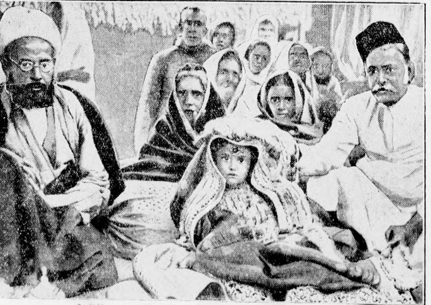
Indiában megtiltották a gyermekházasságokat. Egy hat éves menyasszony rokonai körében a menyegzői ünnepségen.