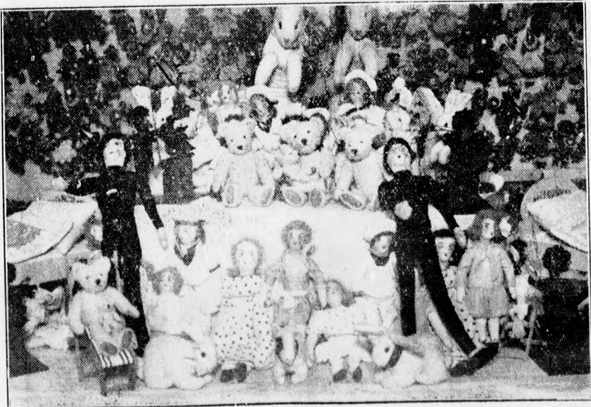
A Csapó uccai egyházzrész ma megnyíló korácsnyi vásárából.