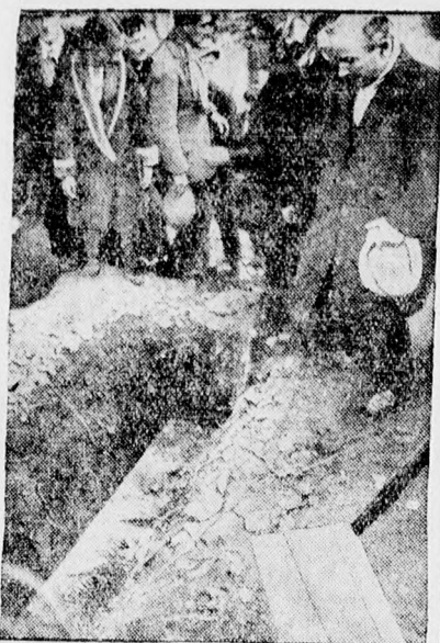
Clemenceau temetése. A nyitott sírnál.

kerékpárral való ellátásáról is. Eddig egyetlen vidéki kapitányság sem tudott hozzájutni ehhez a fontos járműhöz, amely nagyon megkönnyítené a menekülő bűnözők üldözését, gyorsabbá tenné a nyomozások tempóját. A detektíveknek néha bizony ugyiszólván a kezükből kell kiengedni a gonosztevőket, mert azoknak sokkal előnyösebb a helyzetük, rendelkeznek járművekkel s így kimennek a kelepceből. Néhány oldalkocsis motorkerékpár nemcsak a gyors nyomozást tenné lehetővé, hanem az éjszakai preventív szolgálatnál is megbecsülhetetlen szolgálatot tenne.