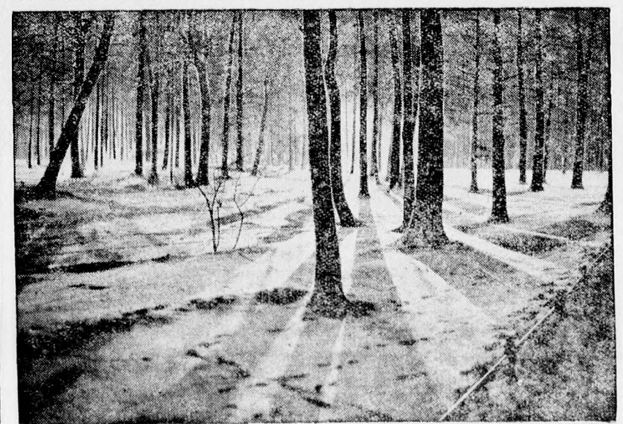
Téli éjszaka a debreceni Nagyerdőn.

Budapest, december 30. Az 1930-31. évi költségvetés során igen beható tárgyalás alá vették az állami üzemek sorsát is, amelyeknek költségvetési kereteit a pénzügyminiszter szintén lényegesen mérsékelni kívánja.