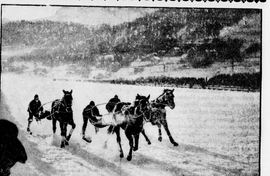
Megkezdődött a téli élet St. Moritzban. — Balra: Egy szép ugrás. Jobbra: Versenyfutás a jégen.

1929 decem... U FEU A DEBRE... Kiadóhivatal... Szerkesztőség... — Övé estély... 3 órákor... templomban... a Kossuth ucc... Bajla Mihály... Kolozsváry K... után fél 3 ór... dr. Révész Im... — A nyilas... den, övé delu... tart Papp Imu... — A Homoc... 3 órákor iste... Gyula. — Istentis... A Szappanos... házbán kedde... Tóth József... vább szerde... 6—7-ig evar... estély vegye... — Felhős... teoreológiai... dében 12 ór... dős idő uralk... két foknyi n... körül van. L... de többnyire... ben. Jólát: l... yeken kisebb... telen hovált... — Elnöki... Párt vezetős... ján délelőtt... ben elnöki é... megí Kiss Pá... vesz. — A debre... latának rend... köztisztvisel... 7-én délután... helyiségében... melyre a tag... seg. Tárgy: a... Ezen... dalmi kap... gyengék é... veszedelm... tikuhan a... foglaló ka... poton bizt... tenzítésáv... legrejtelm... és megaka... ahol mind... behelásson... a nagy sze... den ellent... Ez a... alatt a C... teljes vilá... mélység... szerelem... temben el... nyegető k... met elfúj... Élete... most. Halál... jó ideig r... ezer új v... zettel. K... legjobban... észrevette... annak, ho... felé. A te... veszélyek... Éjjel... E hányott... csolódnon... rendelkez... szívós, ke... problémát