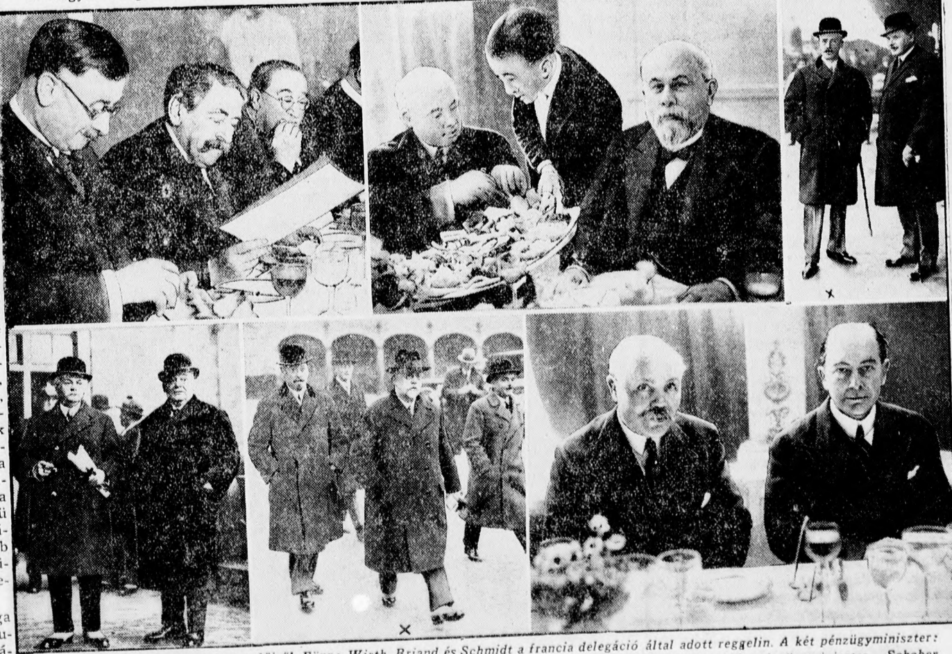
Képek a hágai konferencia szereplőiről. Fönn: Wirth, Briand és Schmidt a francia delegáció által adott reggelin. A két pénzügyminiszter: Moldenhauer és Cheron. Bethlen miniszterelnök. (X) — Lenn: Jaspas a belga miniszterelnök és Franqui pénzügyminiszter. Schöber osztrák kancellár (X) a tárgyalásra megy. — Loucheur és Curtius német külügyminiszter reggelizés közben eszmecserét folytatnak.

Hír szerint holnap délutánra a nem német jóvátételekkel foglalkozó bizottság plenáris ülést vett tervbe. A plenáris ülések nyilvánosak.