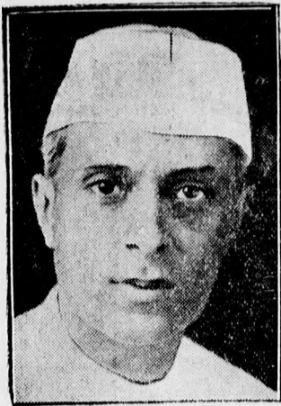
Pandit Jawaharlal Nehru, a hindu mozgalmak vezére.