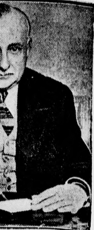
nyol diktátor, akiről y visszalép.