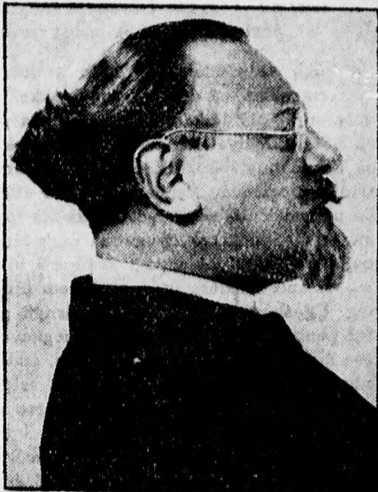
Emil Jannings, a kiváló filmszínész, a Kék angyal című új Ufa film főszerepének maszkjában, mint Prof. Unrath.

A polgármester a rendelkezésnek a szegénységügyi bizonyítványokra és a tisztii orvosok rendelkezésére vonatkozó részét tudomásul vette, a főrészt elsősorban is a közigazgatási bizottság elé vitte.