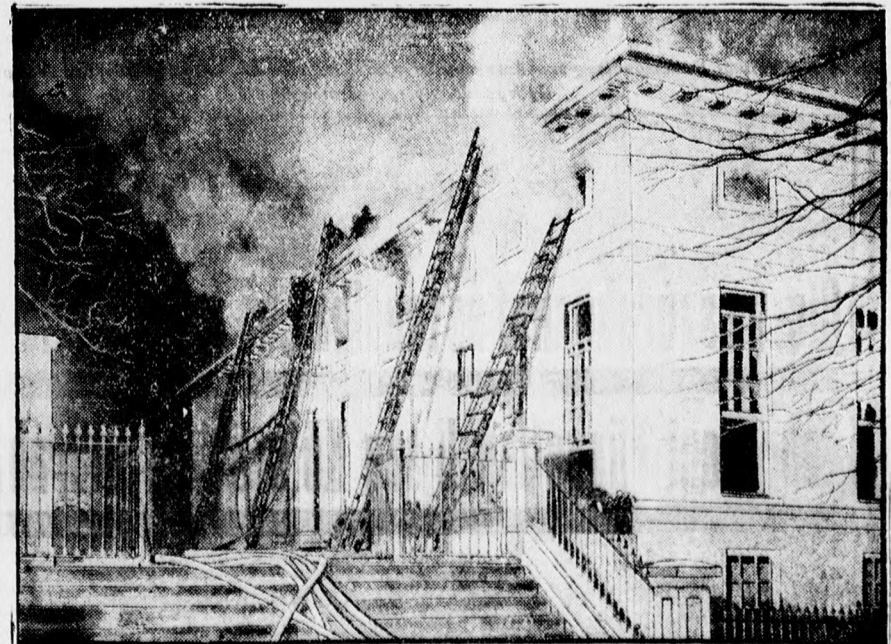
Az amerikai Fehérház, az elnök székhelye, amelynek északnyugati része teljesen leégett.