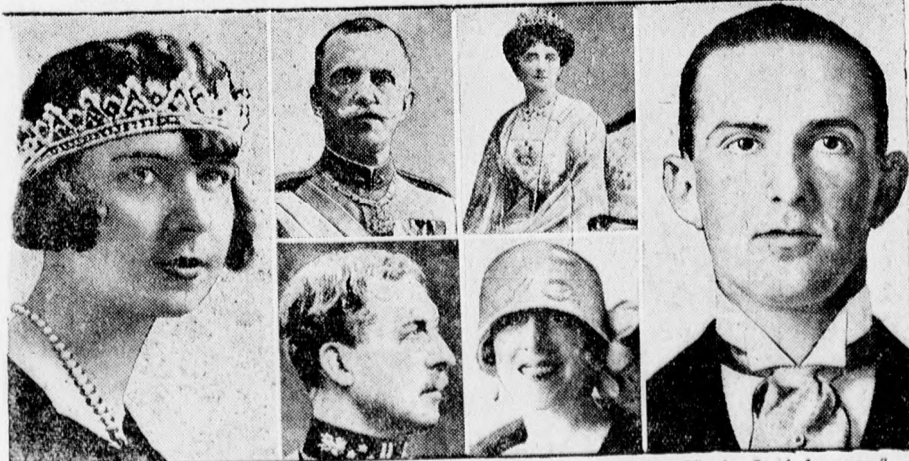
Az olasz trónörökös és a belga királyi hercegnő házassága. Balról: Mária José hercegnő. Középen fenn: A völgegy szülei, az olasz király és királyné. Lenn a menyasszony szülei, a belga királyi pár. Jobbról: Umberto olasz trónörökös.

Boris bolgár király az olasz trónörökös esküvője alkalmából tegnap a római bolgár követ útján magas kitüntetést küldött Mussolininak.