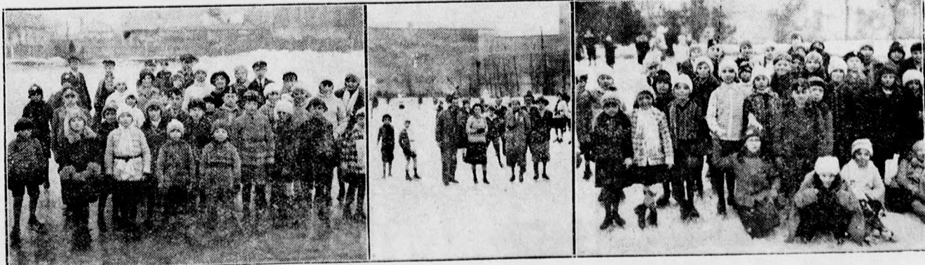
Élet a jégpályákon. A debreceni jégpályákon, mint látható, élénk élet folyik s különösen a serdülő ifjúság és a gyermekek keresik föl nagy elszáratással a jégpályákat. Képeink balról jobbra: A Szapannos uccai jégpálya gyermekközönsége. A DKASE jégpályája. A Svetits-intézeti jégpálya.

Az előadást a magántisztviselők rendezik népszerű helyekkel. Jegyelvételt a magántisztviselők otthonában (az esti órákban), a Menetjegyirodában és a Steaua cégnél. (Telefon 13-23.)