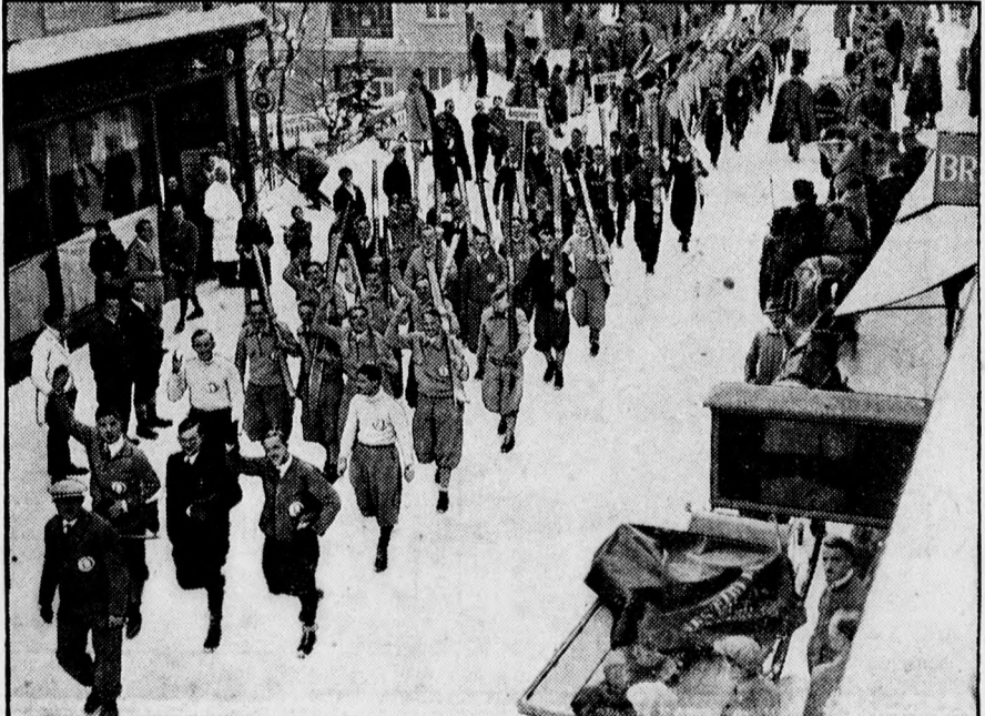
Felvonulás Davosban a téli játékokra.

A rendőr megtette a jelentést, amely arról szólt, hogy az atyafi az egyik külterki koresmában nagy mulatozást rendezett és olyan veszekedést provokált, hogy a közönség érdekében szükségessé vált az előállítás.