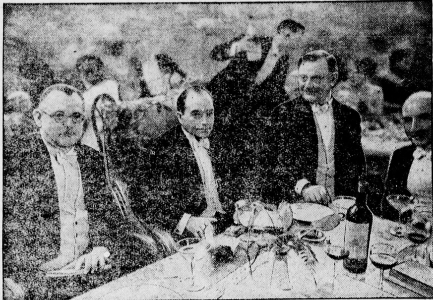
A berlini újságíró bál illusztris vendégei. Balról jobbra: Müller birodalmi kancellár, Curtius, Wirth és Guérard birodalmi miniszterek.