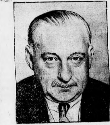
Primo de Rivera, a megbukott spanyol diktátor