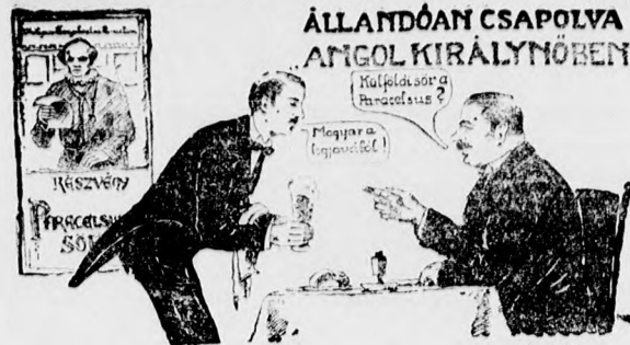
ÁLLANDÓAN CSAPOLVA ANGYOL KIRÁLYNŐBEN

En: Mennyiben fogja az új pogányság a művészetet befolyásolni?