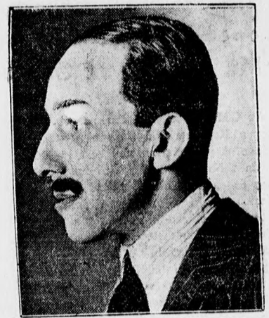
A spanyol diktatura bukása. XIII. Alfonz spanyol király, aki előbb támogatta Primo de Riverát diktátort, most pedig ellene fordult.