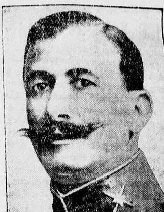
Damiao Berenguer tábornok, az új spanyol miniszterelnök, akit elődje, Primo de Rivera diktátor sokáig börtönben tartott.