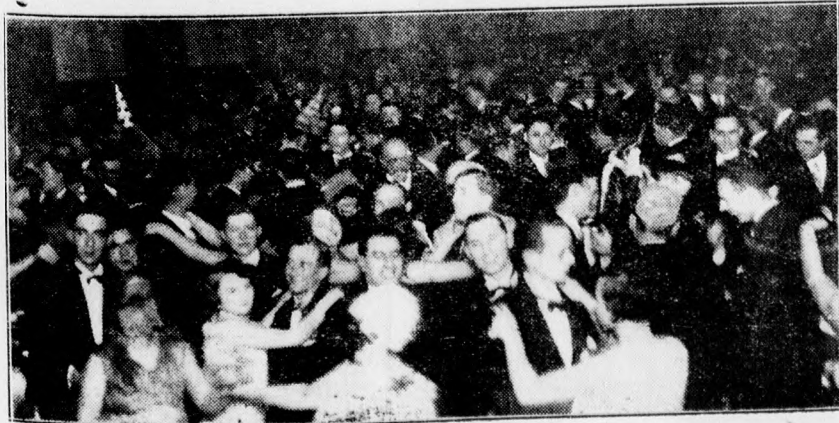
Az ujságírók Görbe Éjszakája: a táncolók egy része.