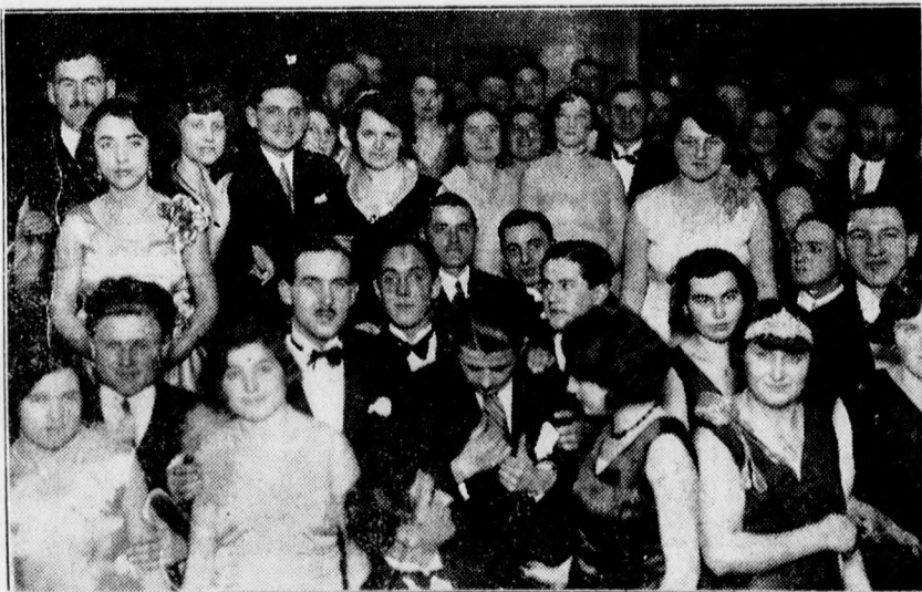
A gópkocsivező bál közönsége.