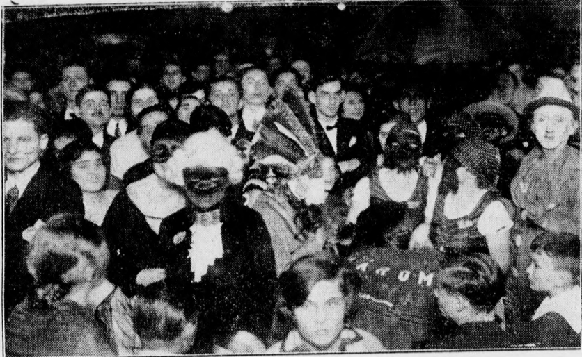
A MAV Egyetértés a vagonjárban pompásan sikerült álarcsbált rendezett. A képünk: a közönség egy része.