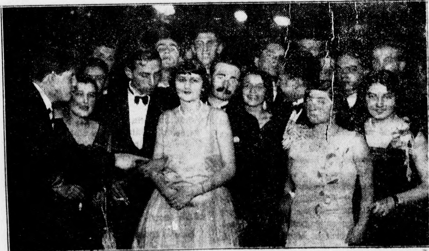
Az OMIKE szombati teasteély közönségének egy része.

nap Liener Béla fényképész-mester foto szaküzlete, amatőr-laboratóriuma és modern képkamerák gyári raktára, amely színes szép világitó reklámaival általános feltűnést keltett és máris igen nagy érdeklődést váltott ki.